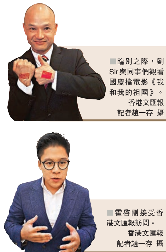
臨別之際，劉Sir與同事們觀看國慶檔電影《我和我的祖國》。