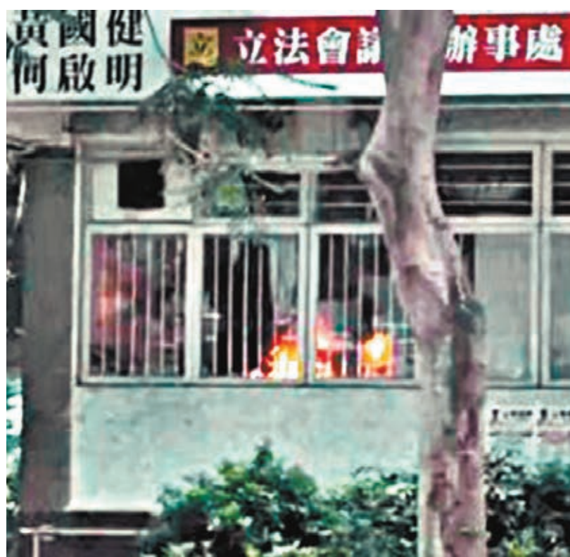
■ 建制派議員譴責暴徒嚴重破壞辦事處行為。