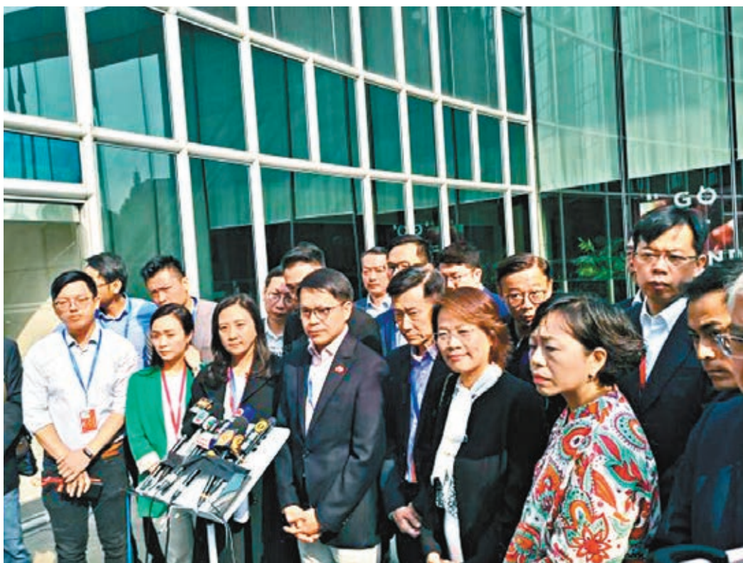
■ 建制派籲政府動用一切可行的法律止暴制亂。

經民聯促請特首及特區政府盡快制定措施，加大力度遏止暴亂，並重申支持警方嚴正執法，盡快緝捕兇徒，止暴制亂，又呼籲社會各界認清暴徒破壞和摧毀香港的真正面目，堅決反對和抵制暴力行為，同心支持特區政府和警方嚴正執法，止暴制亂，讓社會盡快恢復正常秩序。