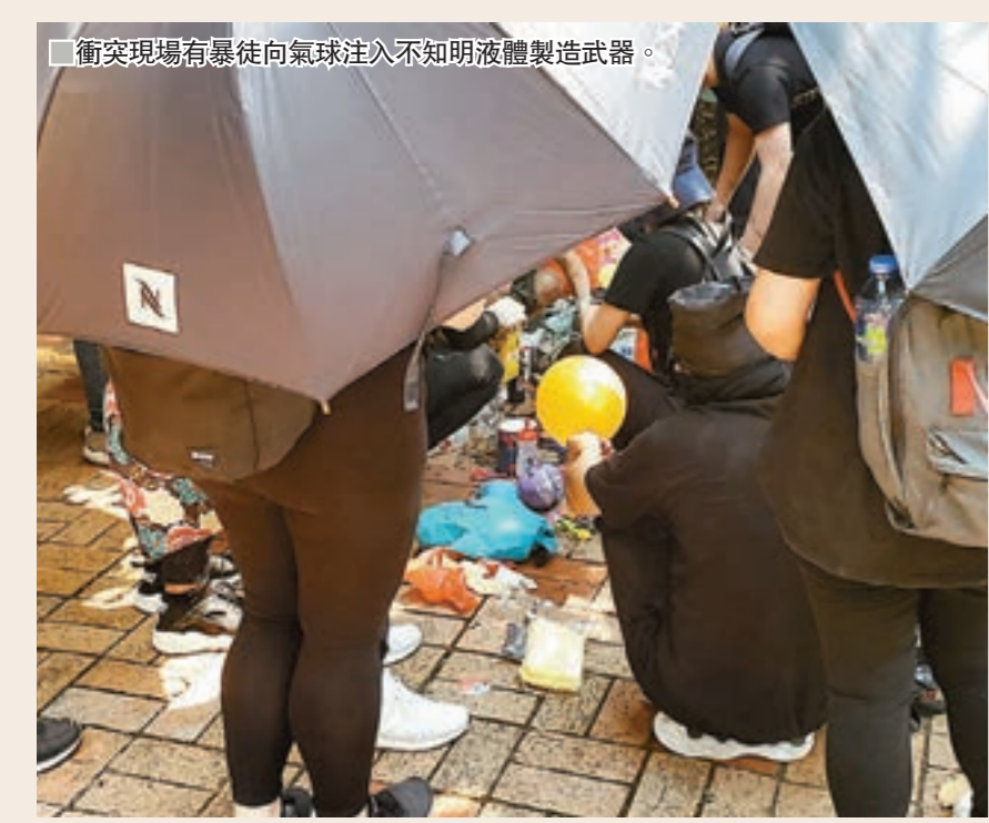
■衝突現場有暴徒向氣球注入不明液體製造武器。