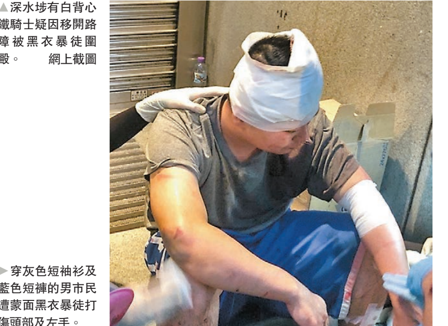
▶穿灰色短袖衫及藍色短褲的男士遭穿黑衣服暴徒打傷頭部及左手。

香港文匯報訊(記者 蕭景源) 為了打壓及排除不同意見者，暴徒「私了」、襲擊持不同政見的市民情況變本加厲。在暴徒大肆破壞、堵路及縱火的旺角區，先後有最少4名市民分別因為用手機拍攝暴徒、怒斥暴徒破壞社會安寧，甚至搬開路障駛走自己的電單車而被行使私刑，均遭大批蒙面的黑衣暴徒圍毆及瘋狂毆打。其中一名事主不但被打至包圍地頭破血流，其手機亦遭暴徒搶去。在暴徒堵路行動不久，一名鐵騎士因為堵路被困路上。他下車搬走路障後，再騎上電單車準備離開，其間電單車失靈，知道路障被人搬走的暴徒趕後，一擁而上圍毆該名騎士。騎士頭部及手腳遭亂拳打中，突然一名綠衣外籍人士到場調停保住騎士，奇怪的是暴徒們對該外籍人士言聽計從，最後放過鐵騎士。