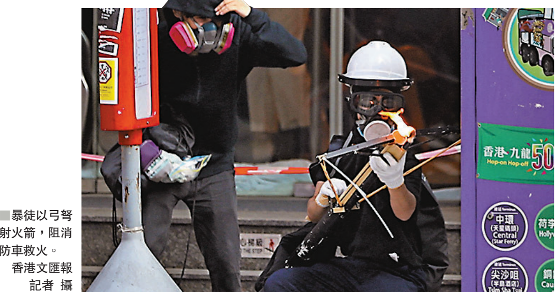
■暴徒以弩射火箭，阻消防車救火。