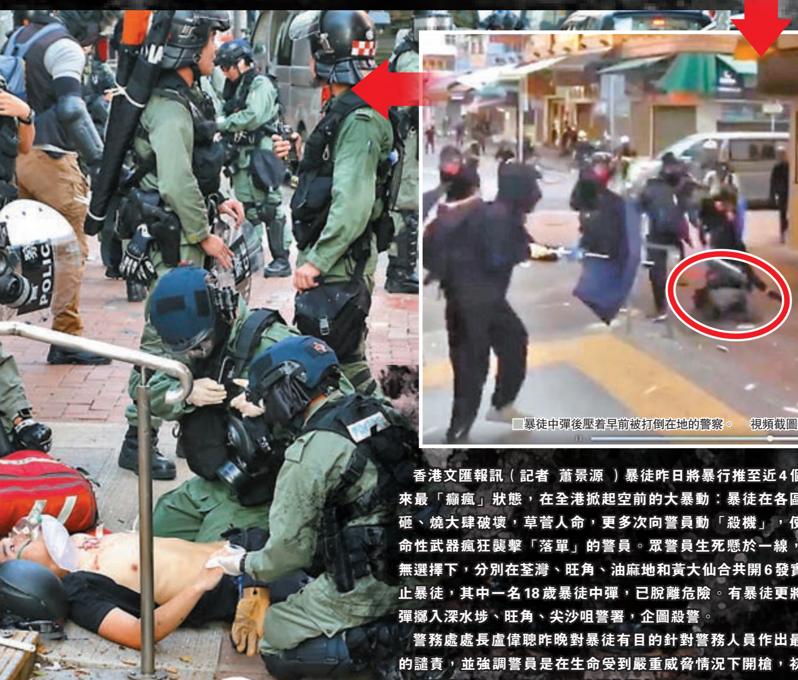
▲數名警員急救中槍者。

香港文匯報訊(記者 蕭景源) 暴徒昨日將暴行推至近4個月以來最「癡瘋」狀態，在全港掀起空前的大暴動：暴徒在各區打、砸、燒大肆破壞，草菅人命，更多次向警員動「殺機」，使用致命性武器瘋狂襲擊「落單」的警員。眾警員生死懸於一線，在別無選擇下，分別在荃灣、旺角、油麻地和黃大仙合共開6發實彈制止暴徒，其中一名18歲暴徒中彈，已脫離危險。有暴徒更將汽油彈擲入深水埗、旺角、尖沙咀警署，企圖殺警。警務處處長盧偉聰昨晚對暴徒有目的針對警務人員作出最嚴厲的譴責，並強調警員是在生命受到嚴重威脅情況下開槍，初步判定合理及合法，但警方會繼續深入調查是次開槍事件。