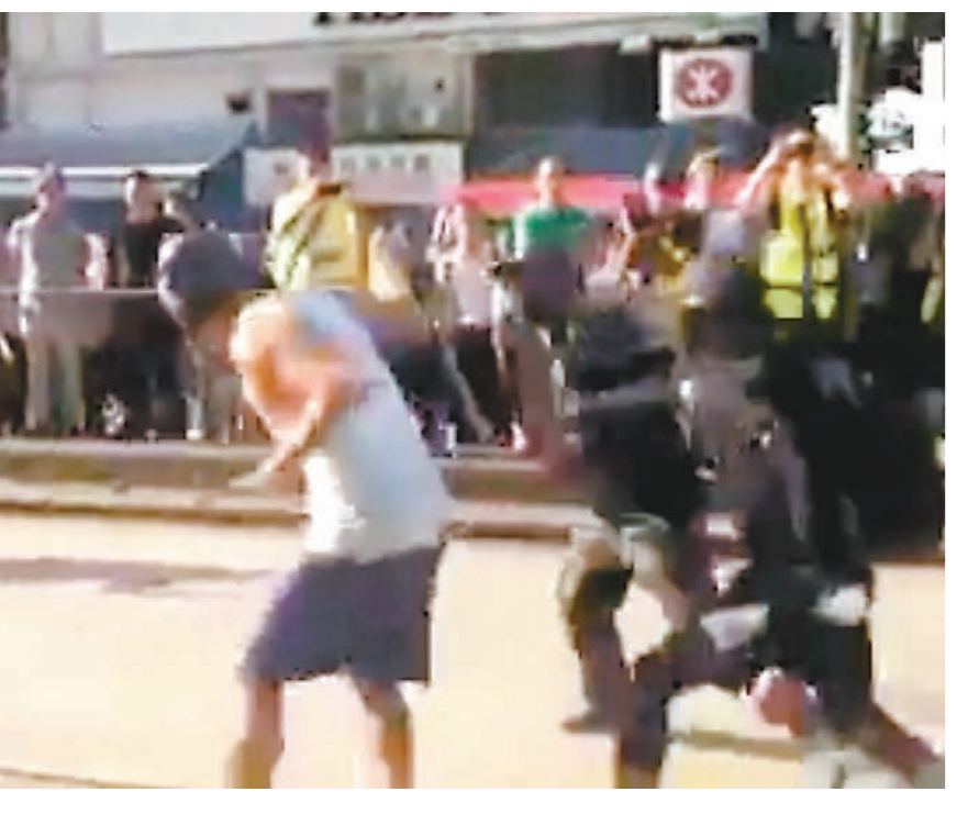
▲深水埗有白背心鐵騎士疑因移開路障被黑衣暴徒圍毆。