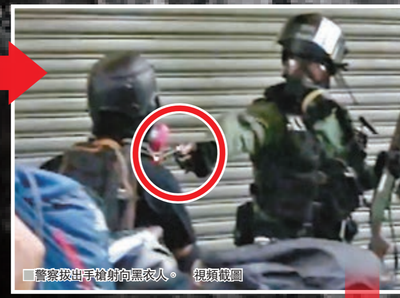
■警察拔出槍射向黑衣人。視頻截圖