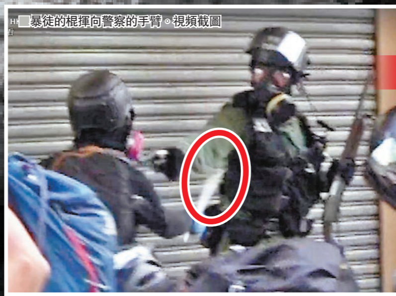
■暴徒的棍棒向警察的手臂。視頻截圖

意。昨日中午，逾百名暴力示威者在屯門政府合署集結與警方對峙，有暴徒突然舉起水槍向防暴警「射水」，多名防暴警及記者猝不及防被「射中」，眾人衣服隨即被腐蝕性液體穿透、冒煙及皮膚灼痛。始知暴徒將強水注入水槍施襲，「中鏢」防暴警及記者需要即時用水清洗傷口，但見受傷位置的皮膚燒傷出水泡。在港島灣仔軒尼詩道近金鐘道，有暴徒使用發射着火