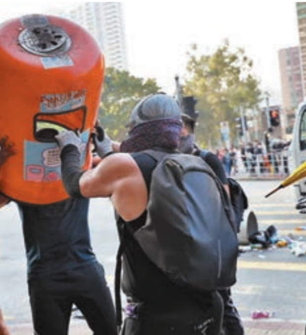
■男司機試圖搬過暴徒所設的路障，遭暴徒圍毆，更以垃圾桶蓋在其頭上。