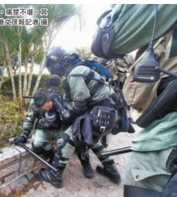
▲一名警員後頸中暴徒棍一棍，痛楚不堪，其他警員上前了解傷勢。

在旺角彌敦道，晚上7時45分左右，一名穿拖鞋及斜袋袋的中年男市民，被指出言指責暴徒惡行，即遭多名蒙面的黑衣暴徒圍毆狂毆，倒地後仍遭暴徒用硬物襲擊身體，有暴徒更乘機向事主面部噴黑色液體，又被人用啤酒「兜頭淋」。暴徒趕後迅速散開。晚上10時許，再有一名中年女子在旺角太子站對開，疑與暴徒一言不合而遭暴徒向其面部噴射黑色漆油。