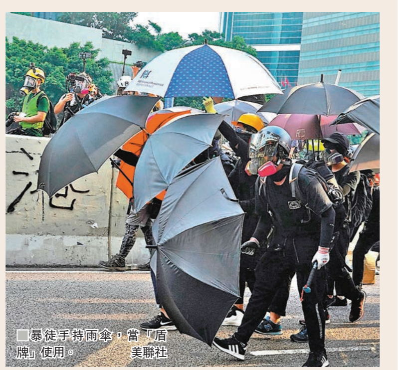
■暴徒手持雨傘，當「盾牌」使用。