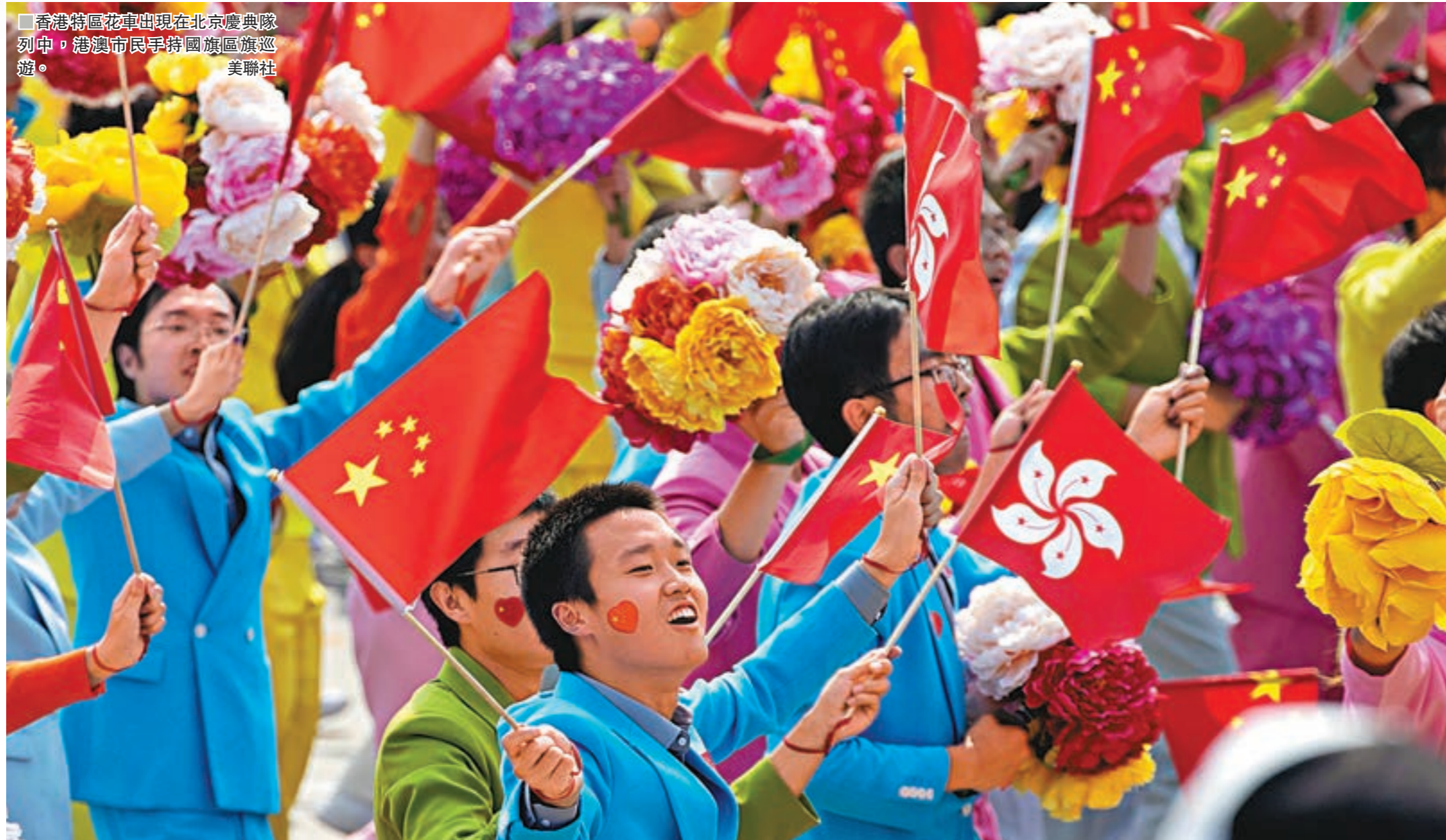
香港特區花車出現在北京慶典行列中，港滬市民手持國旗慶祝。