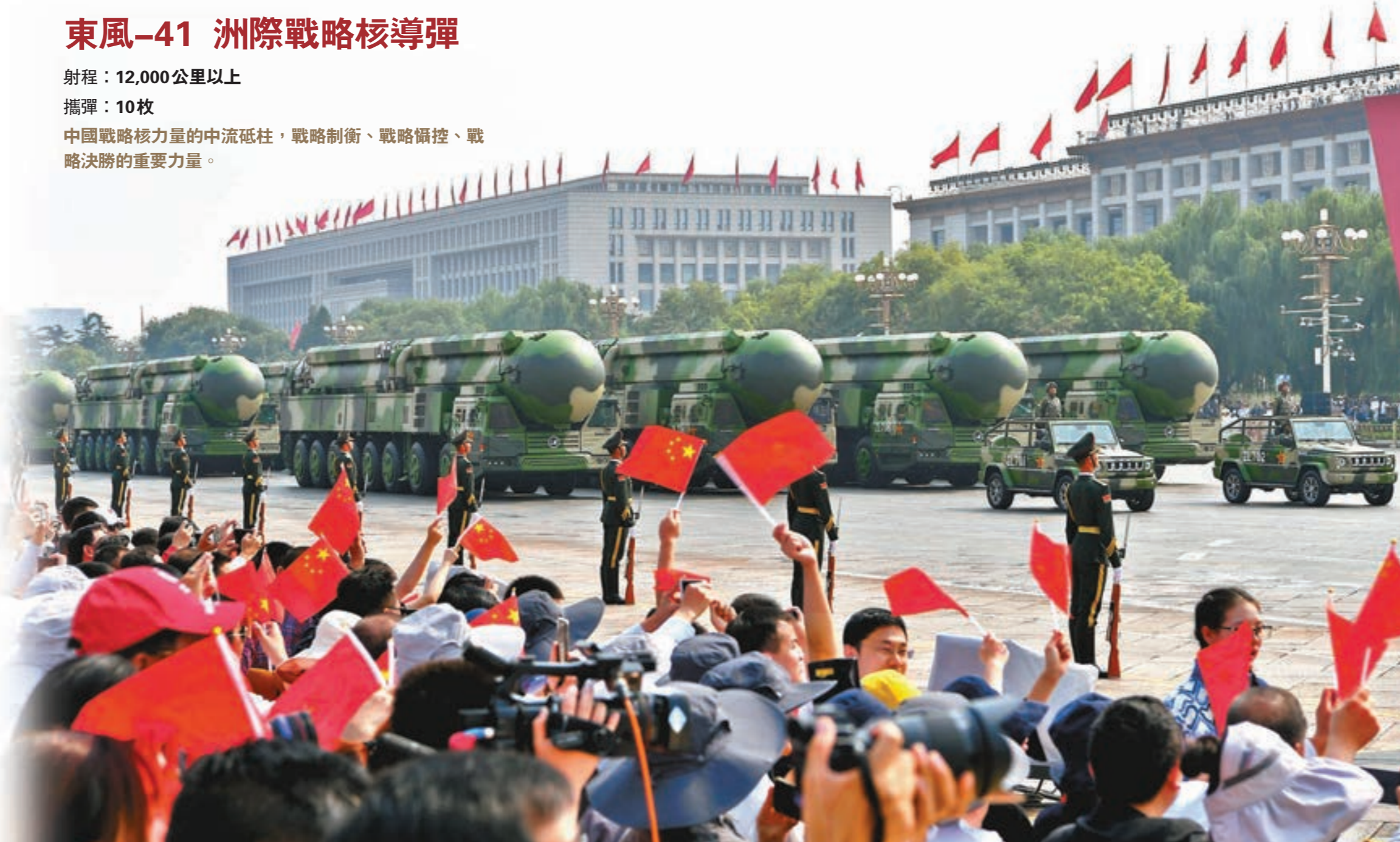
▲10月1日上午，慶祝中華人民共和國成立70周年大會在北京天安門廣場隆重舉行。圖為接受檢閱的東風-41核導彈方隊。