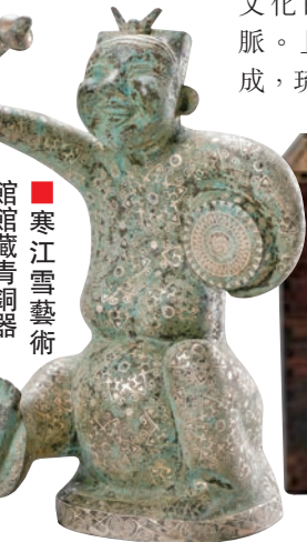
■寒江雪藝術館收藏青銅器