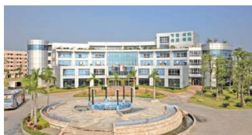
■漳州喜盈門傢俱製品有限公司