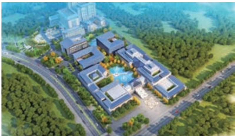
■寒江雪藝術館效果圖