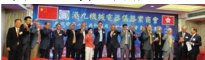
港九機械電器儀器業商會國慶聯歡, 賓主合照。

港九機械電器儀器業商會日前假旺角倫敦大酒樓舉辦慶祝中華人民共和國成立70周年會員聯歡宴會, 邀得立法會議員邵家輝、香港中華廠商聯合會會長吳宏斌、香港中華總商會常務副會長袁武、中聯辦九龍工作部處長吳小剛、中聯辦協調部幹部梁鋒、九龍西區各界協會會長樊煥華、廣州市工商聯副主席余劍春等蒞臨主禮, 與社會賢達、各界嘉賓及會員歡聚一堂, 共賀國慶。