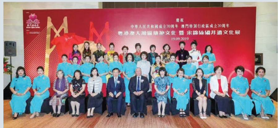
澳門旗袍會舉辦粵港澳大灣區旗袍文化暨宋錦絲綢非遺文化展, 賓主合影。

澳門旗袍會日前假澳門君悅酒店宴會廳舉行成立三周年及第二屆理事就職典禮, 同日為慶祝中華人民共和國成立70周年, 澳門特別行政區成立20周年, 該會舉辦了粵港澳大灣區旗袍文化暨宋錦絲綢非遺文化展。