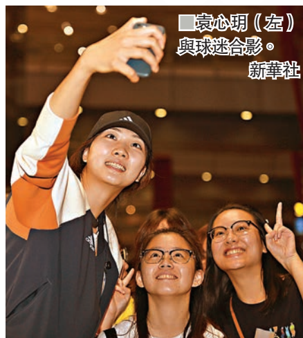
袁心玥(左)與球迷合影。