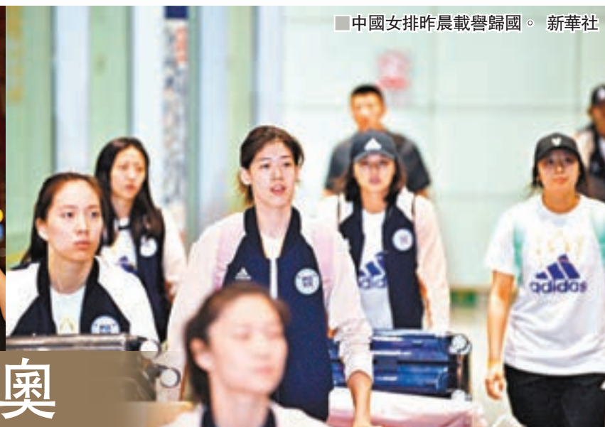
中國女排昨晨載譽歸國。