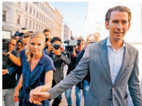
■庫爾茨與女朋友抵達票站。

奧地利昨日舉行大選，根據初步點票結果，前總理庫爾茨領導的人民黨得票達37.1%，拋