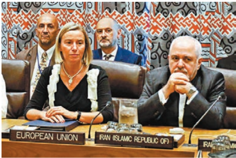
■扎里夫在紐約出席聯合國大會。