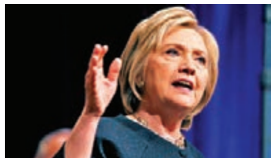
■國務院重新調查希拉里的「電郵門」事件。