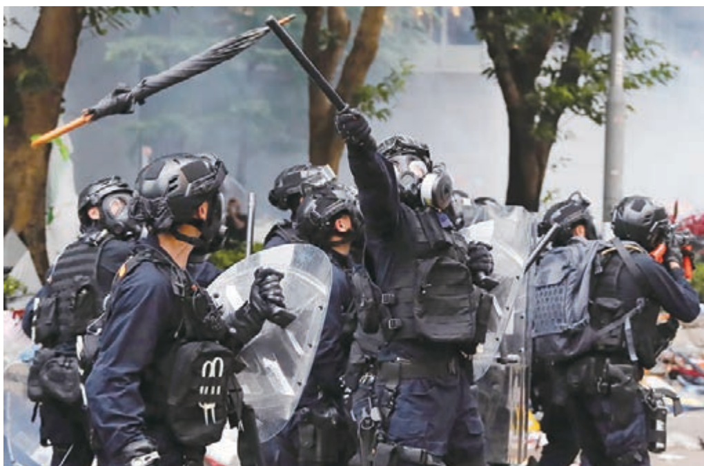
■暴徒投擲雨傘攻擊警方。

當暴徒不滿足以「狗」來發洩內心惡念時，再以「殺人犯」及「強姦犯」等罪名扣到警察頭上，指「就算太子呢件事係真係無人死都好」，都要試着叫警察為「殺人犯」，又將部分無可疑的自殺案件誣稱為「警察殺人」。