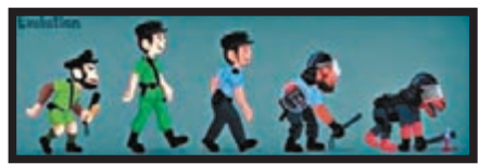
■文宣組製圖辱警。 網上圖片

本月五日，網民「神鋒哥斯達」更在社交網站中寫道：「大家print (列印) 自己識嘅狗大頭照出嚟，貼去佢住嚟區，要話比(界)所以(有)街坊聽佢嗰係殺人犯。」