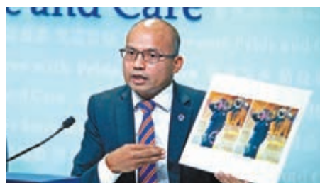
■警方早前澄清「警察扮示威者」的改圖。

除此之外，8月31日有外媒拍到一個暴徒投擲汽油彈，該名暴徒身後更別有一把「槍」，暴徒文宣組又紛紛稱是警方擲汽油彈。