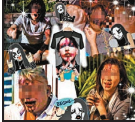
■文宣組製圖恥笑被襲的普通市民，企圖轉移網民對暴力問題的關注。

即時救人，同時向自己防線，拖行跌地的狗狗 -> 石三島「救人，打狗，破壞對方佈陣」