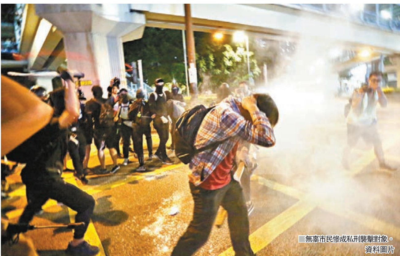
■無辜市民慘成私刑襲擊對象。

非不分，更視搶犯、襲警等違法行為為不見，反而認為他「英勇」，可見漸進式煽暴洗腦奏效。