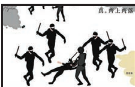
■文宣組教人搶犯和針對警察。

本月中就有暴徒從警察手中搶犯，並一再襲警，最終被警方制服後，竟被暴徒文宣組在網上封為「義士」，而部分網民是