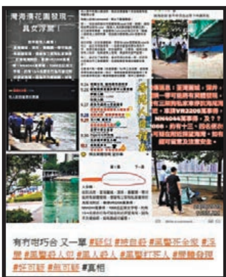
■文宣組誣衊浮屍案為「警察殺人」 網上圖片

除了誣衊警察「濫暴」外，他們又用「狗」來將警察非人化，如畫圖將警察由「狼人進化武裝的狗」，又標明「警即是狗、狗即是警」，在各種非法集會遊行中不難聽到激進示威者稱警察為「狗」，甚至有人在網上指警察是「渣滓蟲蟲」，故意抹黑警察形象。