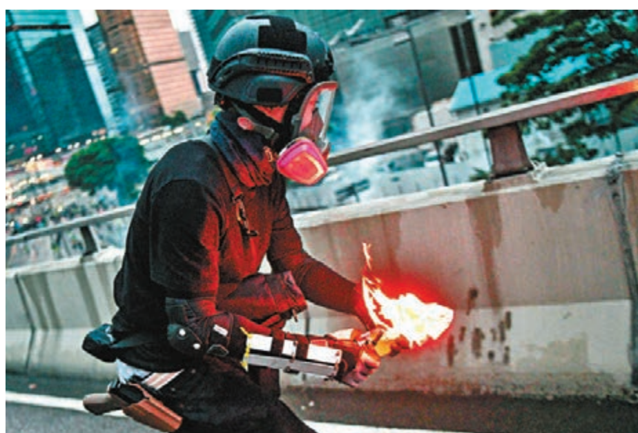
■縱暴派屈中暴徒為警方臥底，警方指其槍械非警隊所使用，全屬抹黑。

此外，暴徒更自製不同武器，如改裝長遮為尖頭以攻擊警員，當被警方在記者會上展示戳穿時，暴徒甚至繼續改圖欺騙市民，企圖轉移市民對暴力問題的關注。