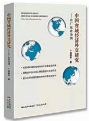
■中國首部省域經濟外交研究專著出版發行。網上圖片

香港文匯報訊 綜合人民網及廣東人民出版社官方微信消息，在中國推進大國和平崛起的偉大進程中，經濟外交在國家及省級次國家區域中的重要地位日益突出。在喜迎新中國70周年華誕之際，一本以此為格局背景並基於廣東案例展開實證研究的學術專著——《中國省域經濟外交研究——以廣東省為例》一書，日前由廣東人民出版社出版發行。