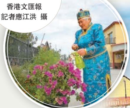
決肯村村民在別墅前賞花。