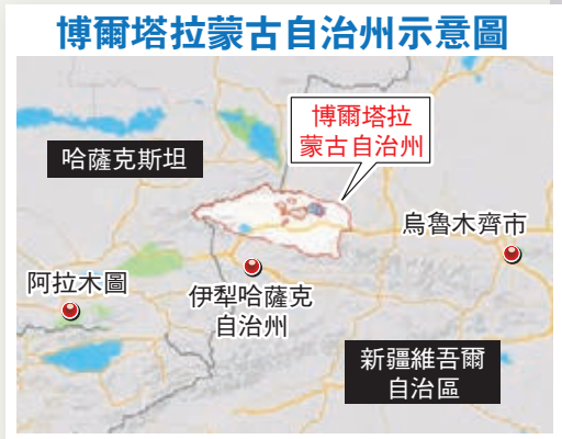
博爾塔拉蒙古自治州示意圖