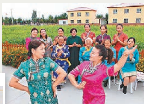
決肯村蒙古族村民載歌載舞為祖國慶生。