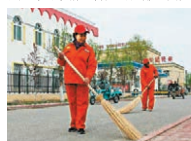
決肯村裡的環衛工人。受訪者供圖