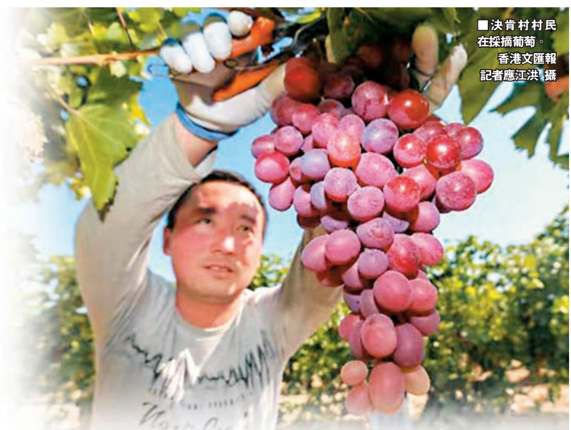
決肯村村民在採摘葡萄。