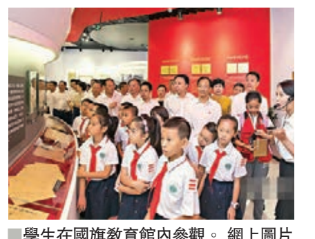
學生在國旗教育館內參觀。 網上圖片

該館展出了從國家博物館和中央檔案館複製的36件館藏藏品，有照片、文件、影像資料等，並製作了40餘件實物模型。館中還有一座曾聯松雕塑，由中國雕塑學會會長曾成鋼創作。天安門地區管理委員會還將一面編號2019—0046的國旗贈予該館。