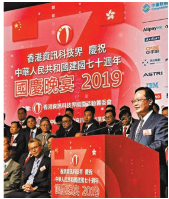
中聯辦副主任陳冬出席主禮香港資訊科技界慶祝中華人民共和國成立70周年晚宴，並致辭。

國慶晚宴由陳冬與特區政府創新及科技局長楊偉雄等共同主禮，1,000多名業界人士出席同慶。