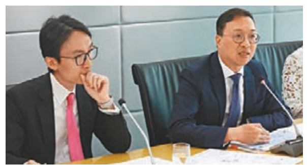
消委會發表有關放債法規的研究報告。

香港消費借貸市場於過去10年快速增長，持牌放債人數目由2009年的779個，激增至今年8月的2,260個，而過去7年，只有8個牌照申請被駁回，一個牌照被吊銷，同時《放債人條例》沿用近40年從沒重大改革，變得不合時宜。消委會建議修改《放債人條例》，以及成立獨立監管機構，規定放債人須評估借款人的還款能力，並建議貸款最高年息上限為48%。 《放債人條例》生效至今近40年，為了打擊「高利貸」，現時由放債人註冊處、警務處和牌照法庭分別規管牌照申請、審查、簽發的事務。消委會指出，《放債人條例》對放債廣告的限制甚少，欠缺特定行業監管機構，牌照申請審查不足，對放債人的行為監管不足、缺乏審慎的信貸評估、濫用諮詢人的個人資料及貸款利息上限過高。 消委會建議，《放債人條例》應加入廣告不應具誤導性內容、不應暗示無論借貸人財務狀況如何均可獲得貸款等要求，宜參考外國規定廣告不得以手法輕鬆、幽默的方式演繹，例如借錢為咗食餐好、借錢去旅行等也是不恰當的宣傳手法；台灣亦不准借貸廣告以學生作宣傳