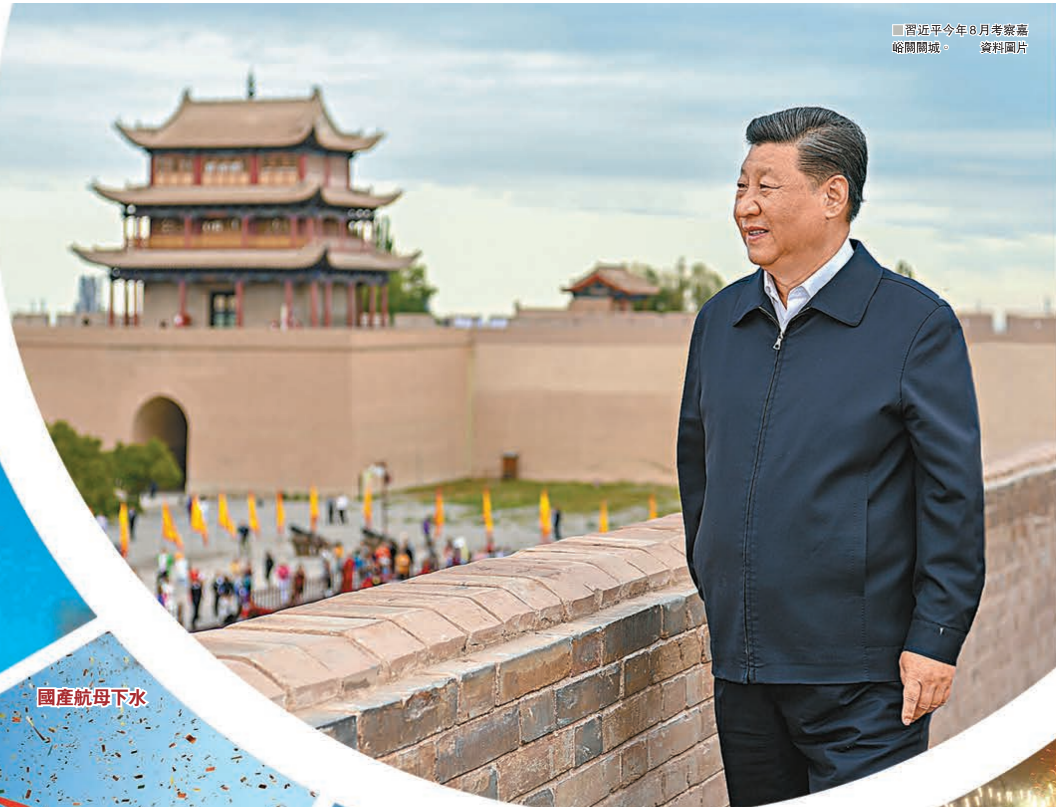
習近平今年8月考察嘉峪關關城。