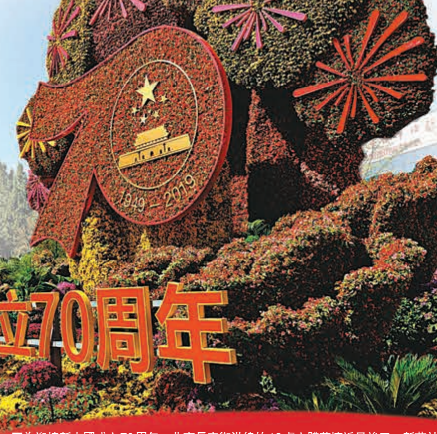
慶祝新中國成立70周年