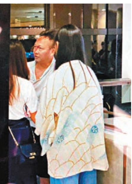
綽號「超人」的休班警員被多名黑衣暴徒圍毆受傷,送院治理。