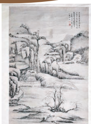
弘仁法師的《寒江蕭疏圖》。