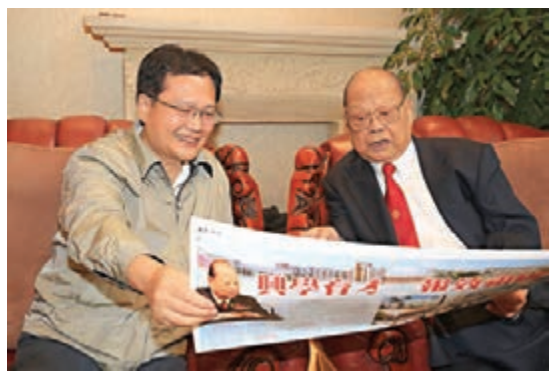
中聯辦副主任陳冬(左)於2017年6月專程赴梅州探望曾憲梓先生。

會因身體原因未能參加，他在家裡舉行了升旗儀式，他從16歲開始唱《沒有共產黨就沒有新中國》一直未斷。他夫人黃麗群大姐在旁補充說，他是一曲定終身，一歌打天下。他畢生都盡最大努力維護國家的利益。 二是他的赤子之心。曾老先生說，他在不同場合說過，來到這個世界上，兩手空空，走時也帶不走什麼，只有在有生之年多為祖國做好事，多為家鄉人民留愛心。從1978年對母校梅縣東山中學第一筆捐款開始，至今公益捐款近2,000次，逾10億元。他的意識中有強烈的「民富國強，教育為本」的崇文重教傳統，於1992年捐贈1億港元，設立了「曾憲梓教育基金」。2003年，中國首次載人航天飛行成功，他又捐1個億，設立「曾憲梓載人航天基金」，以表達其對國家和民族走向強盛的信心和期望。2008年，他再捐1億港元設立「曾憲梓體育基金」，並於2012年、2016年夏季奧運會結束後，兩度分別追加1億港元給體育基金，以獎勵獲得金牌的中國運動員。他的客廳掛着一幅他自己寫的「勤儉誠信」四字書法，他告訴我這是他的理念，也是他的企業精神。他對自己是勤儉苛刻的，但對祖國和人民是慷慨無私的。 昨天，因天氣原因飛機延誤。今天，雖驅車數百公里趕到梅州