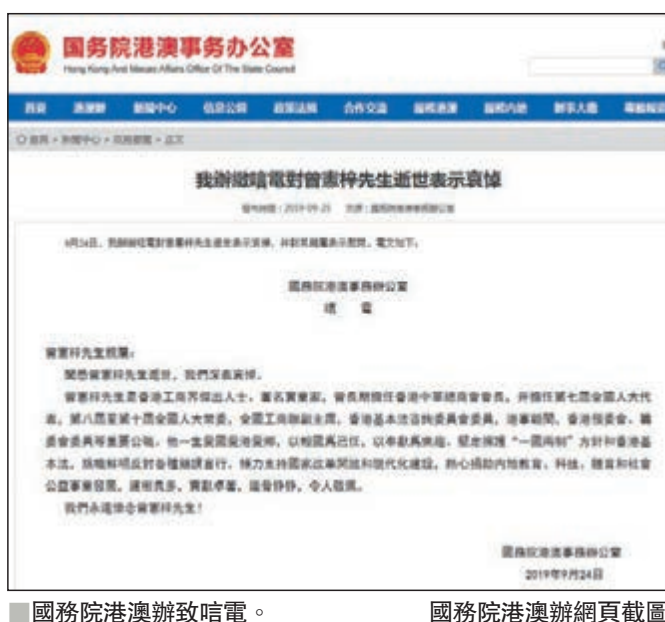
國務院港澳辦致唁電。

人大常委，全國工商聯副主席，香港基本法諮詢委員會委員，港事顧問，香港預委會、籌委會委員等重要公職。他一生愛國愛港愛鄉，以報國為己任，以奉獻為樂趣。堅定擁護「一國兩制」方針和香港基本法，旗幟鮮明反對各種錯誤言行。傾力支持國家改革開放和現代化建設，熱心捐助內地教育、科技、體育和社會公益事業發展，建樹良多，貢獻卓著，鐵骨錚錚，令人敬佩。我們永遠懷念曾憲梓先生！ 國務院港澳事務辦公室 2019年9月24日