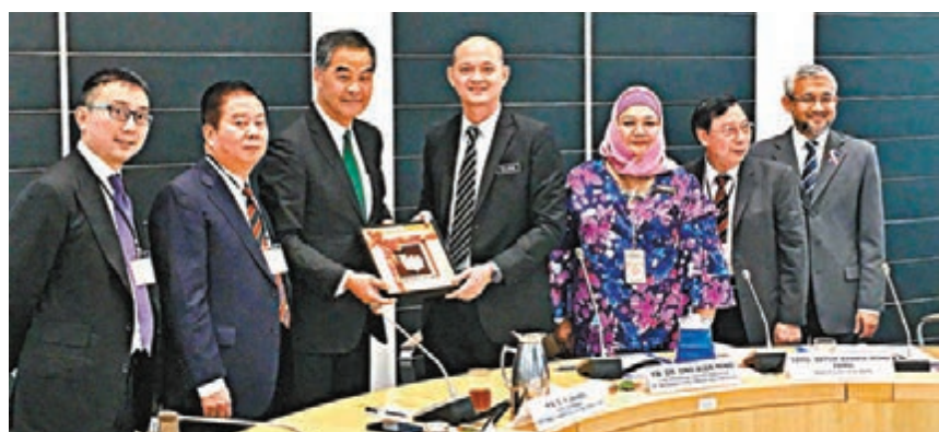
香港中華出入口商會與馬來西亞國際貿易及工業部會面。

【帶路掃描】全國政協副主席、香港特別行政區前行政長官梁振英日前聯同香港中華出入口商會一班年輕企業家，到訪「一帶一路」沿線國家之一的馬來西亞，尋找商機。梁振英認為，社會應鼓勵更多年輕工商專業界人士走到其他國家發掘商機，其中馬來西亞對外資相當歡迎，且屬東盟國家，受惠香港與東盟簽訂的《自貿協定》，對於兩地經貿往來將更加便利。而近年中國與馬來西亞之間正積極拓展貿易生意，香港更應發揮傳統上「超級連繫人」的角色。