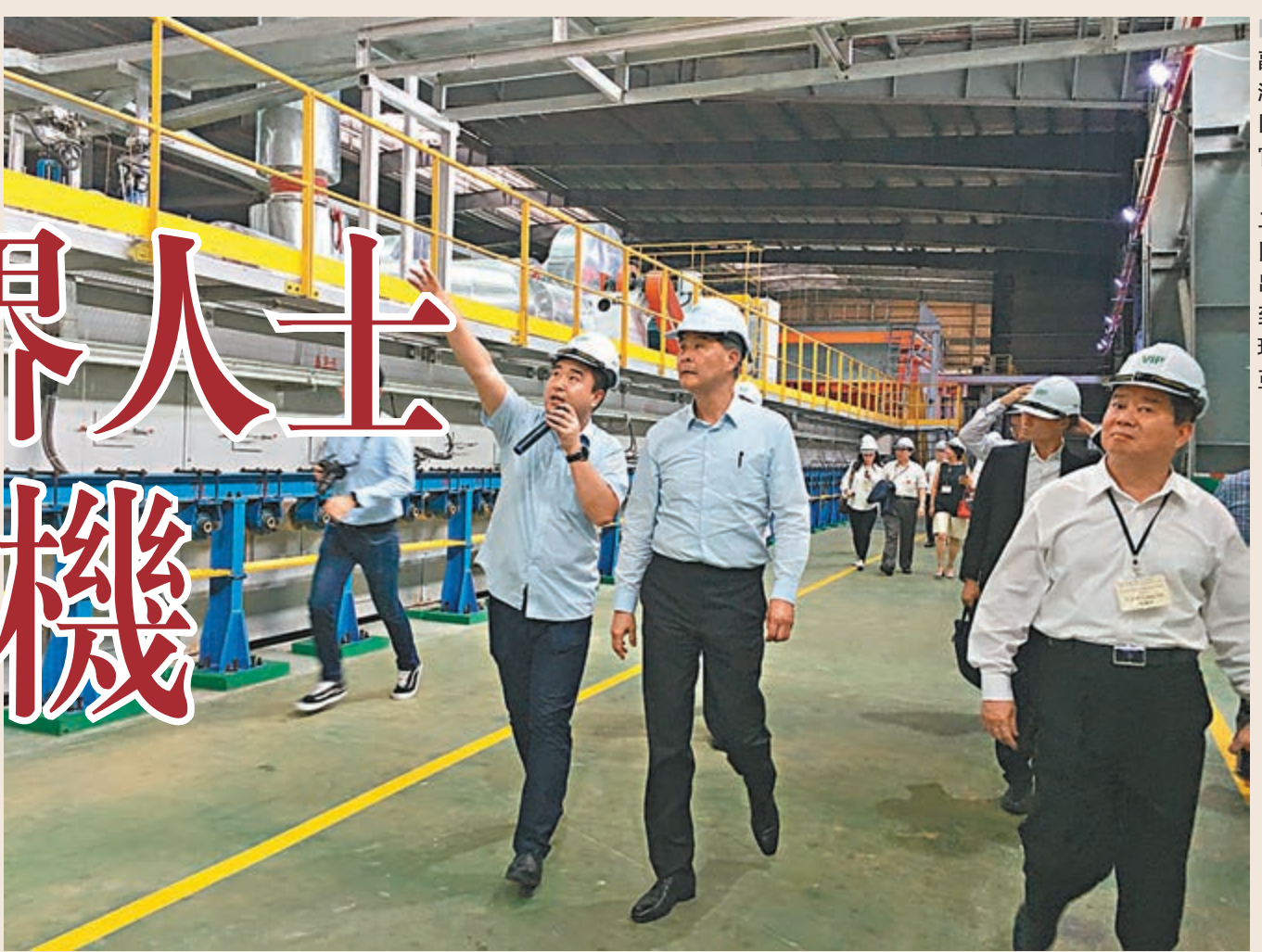
全國政協副主席、香港特別行政區前行政長官梁振英(前排右二)早前聯同香港中華出入口商會到訪信義玻璃於馬來西亞廠房。

【帶路掃描】全國政協副主席、香港特別行政區前行政長官梁振英日前聯同香港中華出入口商會一班年輕企業家，到訪「一帶一路」沿線國家之一的馬來西亞，尋找商機。梁振英認為，社會應鼓勵更多年輕工商專業界人士走到其他國家發掘商機，其中馬來西亞對外資相當歡迎，且屬東盟國家，受惠香港與東盟簽訂的《自貿協定》，對於兩地經貿往來將更加便利。而近年中國與馬來西亞之間正積極拓展貿易生意，香港更應發揮傳統上「超級連繫人」的角色。