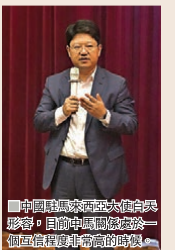
中國駐馬來西亞大使白天形容，目前中馬關係處於一個互信程度非常高的時候。

國會議員是華人。目前華人佔當地總人口比例23%，並且是經濟發展的主流，因為華人大多數從商，包括金融業、建築業、製造業，當地前10大富豪，就有9個是華人，包括首富郭鶴年。