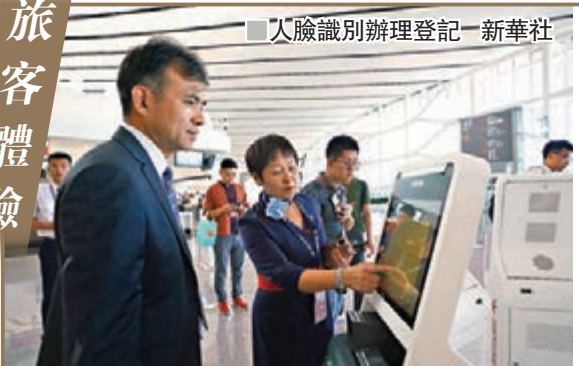
■人臉識別辦理登記