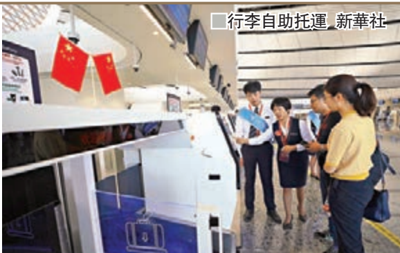
■行李自助托運