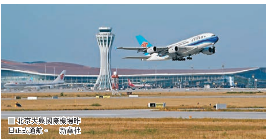
■ 北京大興國際機場昨日正式通航。 新華社