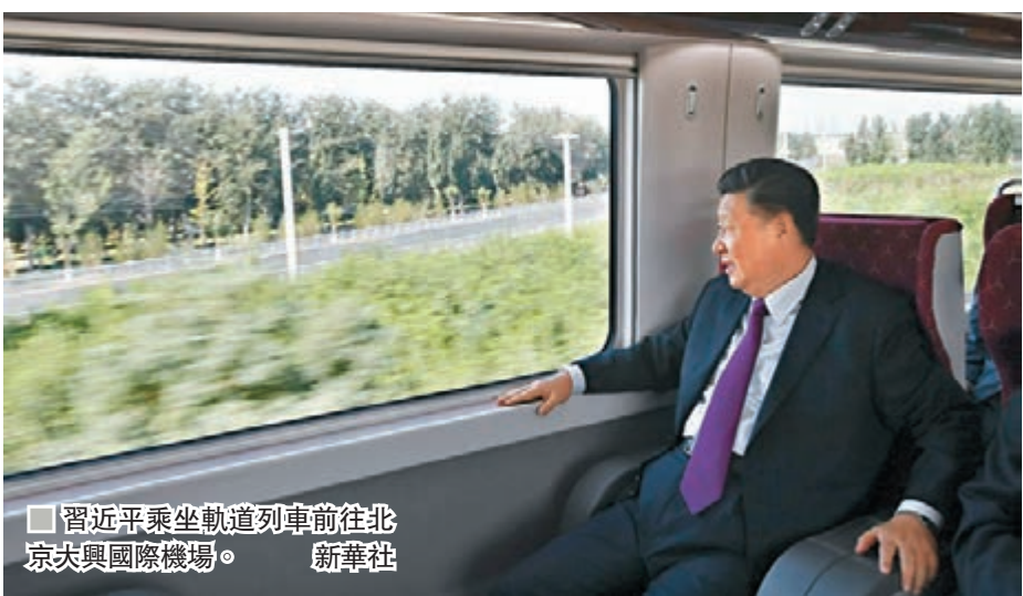
■ 習近平乘坐軌道列車前往北京大興國際機場。