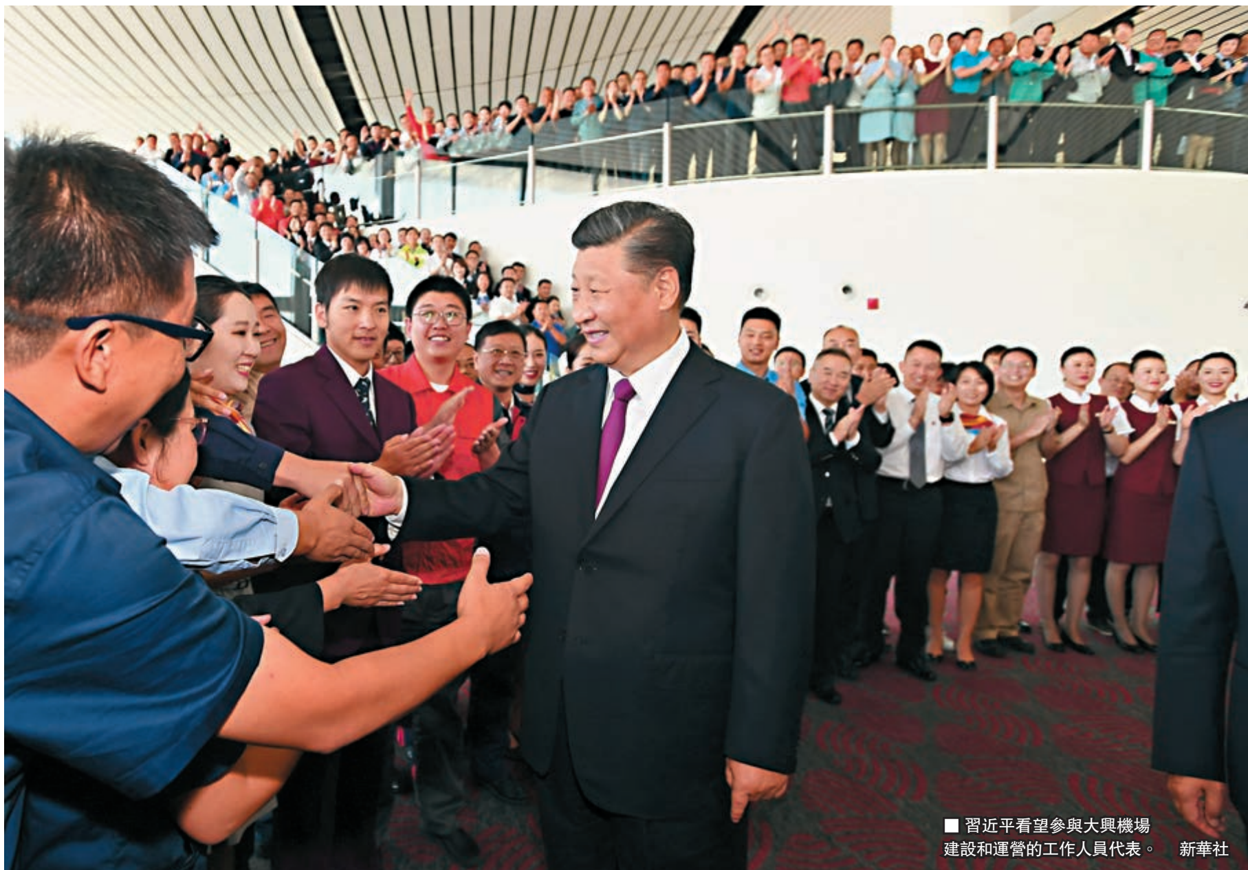
■ 習近平看望參與大興機場建設和運營的工作人員代表。