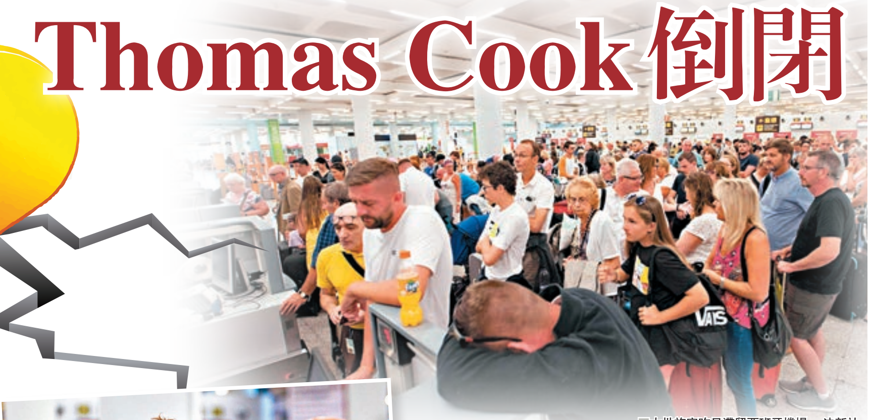
大批旅客昨日滯留西班牙機場。

有178年歷史的 Thomas Cook 業務遍全球，在16個國家經營酒店、航空公司及旅行社，旗下4間航空公司的航班覆蓋歐洲、亞洲、北非及加勒比海地區。但隨着網上旅遊及酒店平台發展，整體旅遊模式改變，加上脫歐問題打擊旅遊的需求，令這家每年接待2,000萬旅客的老牌旅行社經營陷入困難，累積負債達17億英鎊(約166億港元)。