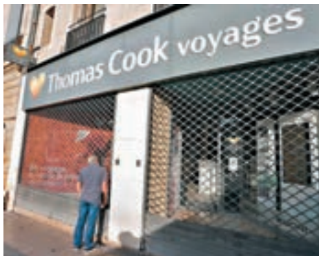
法國的 Thomas Cook 門市昨日拉下大閘。