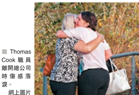
Thomas Cook 職員離開總公司時傷感落淚。網上圖片