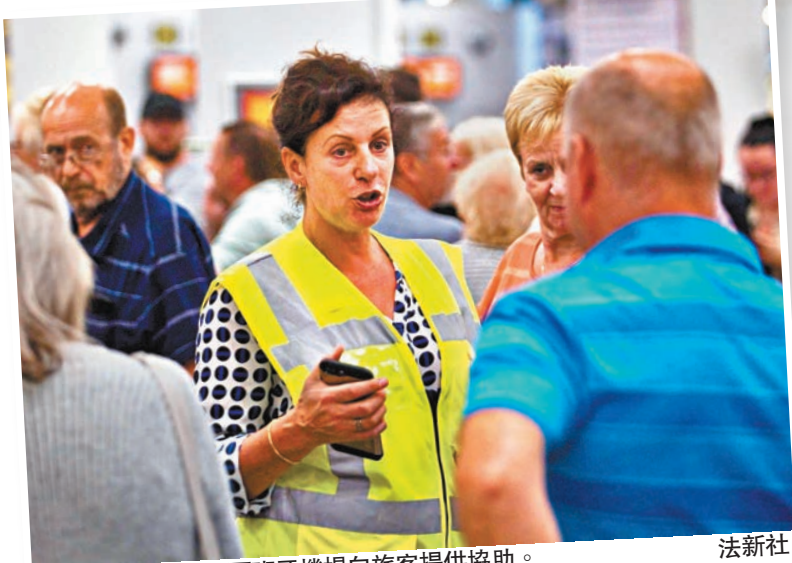
英國政府派人到西班牙機場向旅客提供協助。