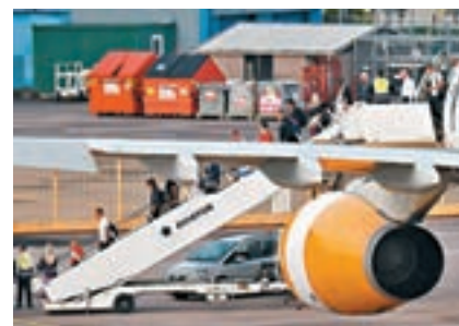
Thomas Cook 旗下客機昨日降落曼徹斯特。