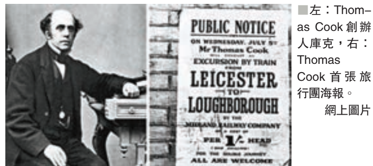
左：Thomas Cook 創辦人庫克，右：Thomas Cook 首張旅行團海報。

Thomas Cook 在1920年代後期陷入財困，庫克家族第三代於1928年賣盤，由經營「東方快車」的比利時公司接手。Thomas Cook 之後經歷多次收購及合併，戰後更一度被收歸國有。1990年代德國資金入主後，公司多次擴張，成為業務遍及16國及自設機隊的多元化旅行社，但生意卻愈來愈難做，加上近年脫歐爭議影響英國民眾外遊意慾，終走上破產清盤的結局。