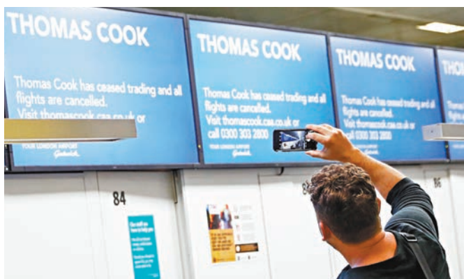
機場屏幕發佈 Thomas Cook 倒閉的消息。