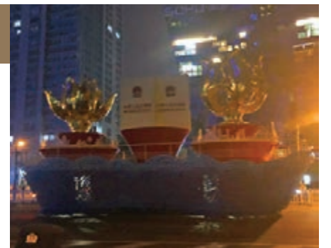
港澳基本法彩車。

這次亮相的香港彩車上半部分也基本露出全貌,車頭是一個金色大圓球,車身上還有兩個巨大的正方體和倒梯形的多面大屏幕。澳門花車上則增加了大三巴牌坊等澳門知名特色建築造型。