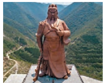
■ 山西省運城市,無人機航拍關公故里——常平村的巨型關公銅像。資料圖片

此次入展的都是兩岸青年藝術家 and 創作者精心構思創作的作品,折射出青年一代寫好中國字、畫好中國畫、傳承好關公文化的精神風貌。一幅幅筆墨精妙、充分表達了兩岸同胞傳承中華優秀傳統文化、推進兩岸和平發展的共同心願。