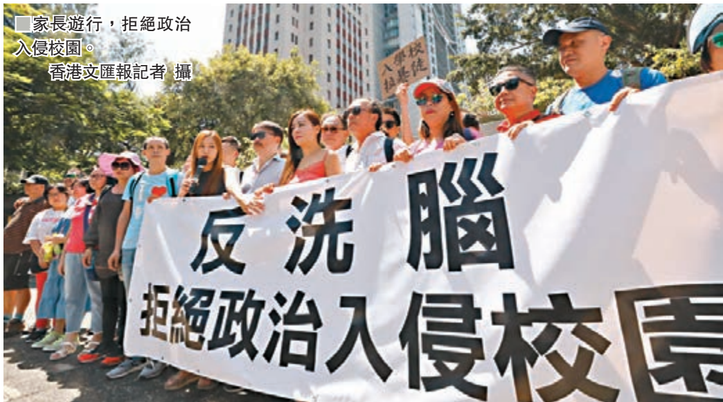
家長遊行，拒絕政治入侵校園。