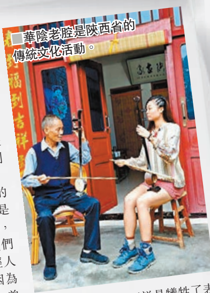
華陰老腔是陝西省的傳統文化活動。

舊有文化要引人注意，文化傳承人們便要各施各法，有的把文化演變成商業活動，就如打樹花，在旅客欣賞表演後講述背後的歷史；有的則加入創新元素，混合現代風格，使活動更為吸睛。就如華陰老腔，新元素的加入使其舊有文化得以傳承，「要吸引新一代的人就要加入他們喜愛的元素，因此華陰老腔新加入曲搖滾樂的人合作，加入新元素後多了人了解，慢慢再潛移默化地訴說本來的歷史。」Whitney 道。華陰老腔是陝西省華陰市張家戶族的家族戲，其聲腔調帶給人壯烈激昂的感覺，融合搖滾樂風格後既不失原來的磅礴豪邁，反之多了一種時尚感，與新派流行曲搖滾樂進行跨界合作。