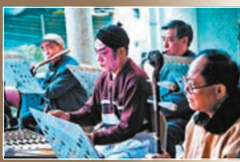
每逢周日便有劇團前來江門新會會城街道石戲台演出。