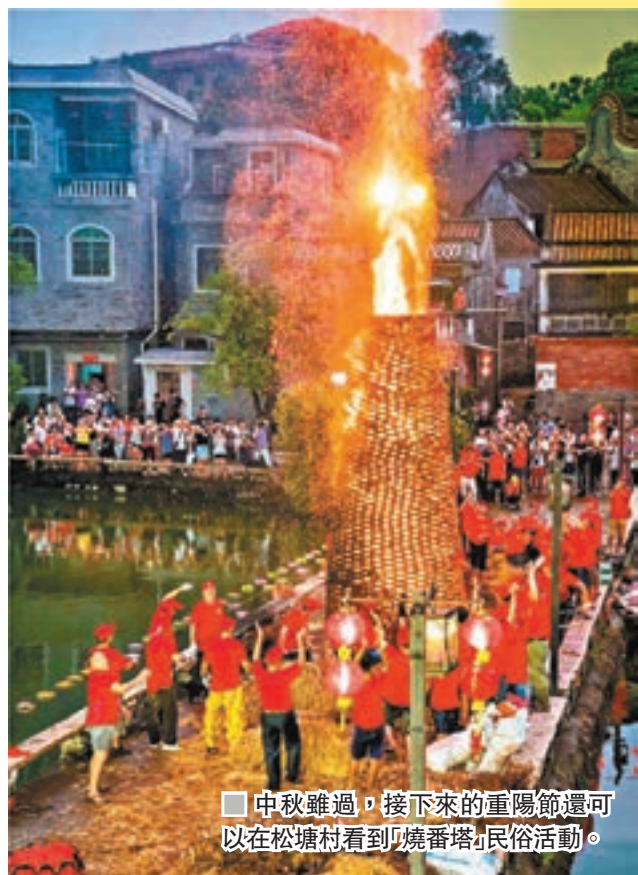
中秋雖過，接下來的重陽節還可以在松塘村看到「燒番塔」民俗活動。