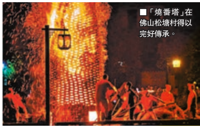
「燒番塔」在佛山松塘村得以完好傳承。