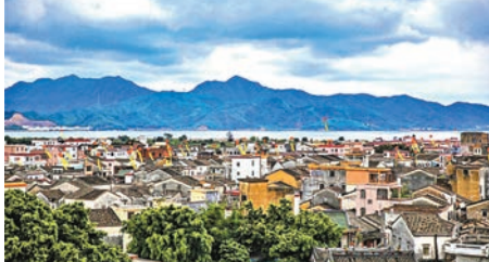
在豬山上俯瞰惠州范和村，遠處便是大亞灣。

豬山是風水命脈，因此在附近興建了不少神廟，譚公祖廟、文昌宮、將軍廟、城隍廟、玄帝宮等。