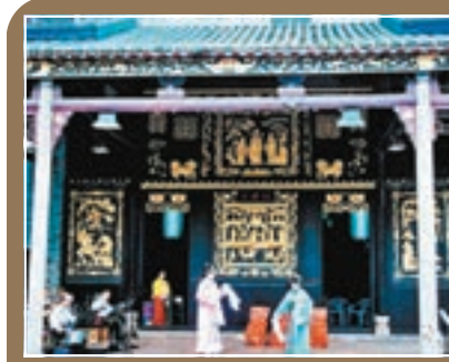
江門新會石戲台，400年來好戲不斷。

不過，歷經400年風雨的新會石戲台，也需經過多個時代的能工巧匠精心修復，才得以保存至今。最近一次全面修繕石戲台還是10年前，當地政府按照原建築風格和工藝、構造特點等，修復天面、牆體、木構件，進行防腐、防蛀、防火處理。這種對原有歷史、藝術的保護，也深得當地民眾讚許。