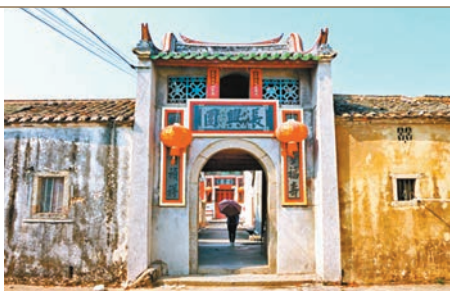
惠州范和村600年的小漁村曾富甲一方。

熱心的村民有自己的一套「導遊詞」。諸如，范和村登山可樵，出洋能漁，攔潮曬鹽，曾富甲一方。如果有精力想要俯瞰整個小漁村的全貌，譚公廟背後的「豬山」佔據全村制高點。在那裡放眼望去，小村風光一覽無遺，大亞灣就在眼前，最遠的亞婆角依稀可見。范和村村民認為，