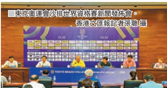
東京奧運會沙排世界資格賽新聞發佈會。

香港文匯報訊（記者張聰報導）東京奧運會沙排世界資格賽昨日在山東海陽開賽，2019年國際排聯積分世界排名前15名的國家以及東道主中國隊，男女共計32支隊伍將於海陽國家沙灘體育健身基地展開2020東京奧運資格爭奪。