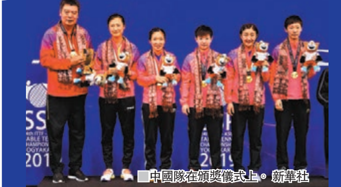
■中國隊在頒獎儀式上。新華社

本屆亞洲乒乓球錦標賽日前上演女團決賽，結果中國隊以總比分3：0戰勝日本奪冠，這也是中國女團連續第七次獲得亞錦賽冠軍。