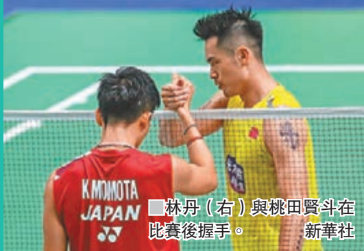
■林丹（右）與桃田賢斗在比賽後握手。

亞洲聯賽冠軍盃（亞冠盃）昨日進行8強次回合比賽，結果中超勁旅廣州恒大作客以1：1賽和衛冕的日本代表鹿島鹿角，兩回合合計總比數同樣為1：1，恒大憑作客入球優惠晉級4強，對手為另一日本代表浦和紅鑽。