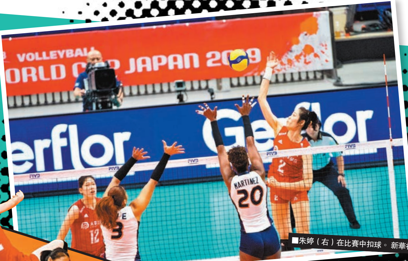
■朱婷（右）在比賽中扣球。