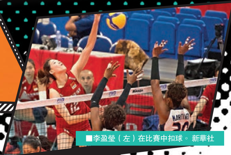
■李盈瑩（左）在比賽中扣球。