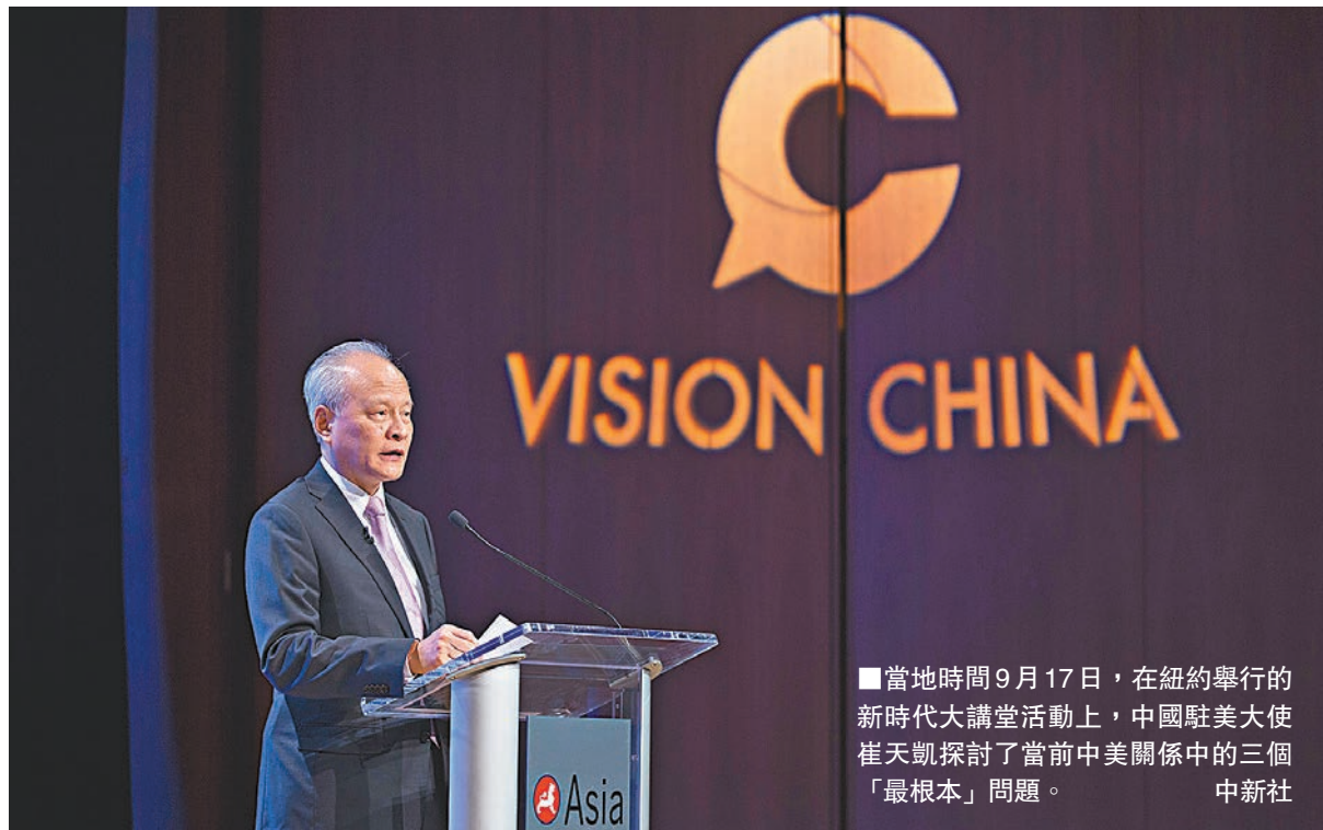
當地時間9月17日，在紐約舉行的新時代大講堂活動上，中國駐美大使崔天凱探討了當前中美關係中的三個「最根本」問題。

香港文匯報訊 據中新社報道，在當地時間17日於紐約舉行的新時代大講堂活動上，中國駐美大使崔天凱探討了當前中美關係中的三個「最根本」問題。