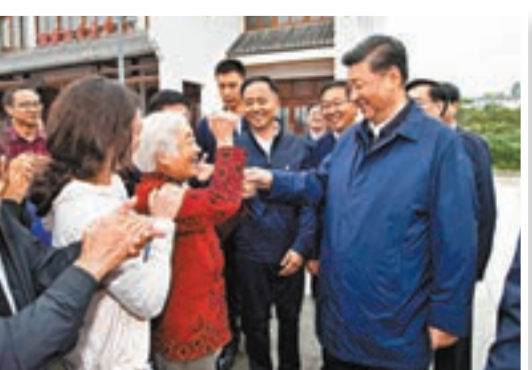
■習近平到光山縣東嶽村考察當地脫貧攻堅工作成效和中辦在該縣扶貧工作情況。

在村文化接待中心，村民代表向總書記匯報了近年來發展特色產業、帶動鄉親脫貧致富的情況。習近平強調，黨的政策好，還要靠大家去落實。你們要自力更生、自強不息，不僅自己脫貧，而且要爭當脫貧致富的帶頭人。我一直強調扶貧既要扶智，又要扶志，一個是智慧，一個是志氣，不光是輸