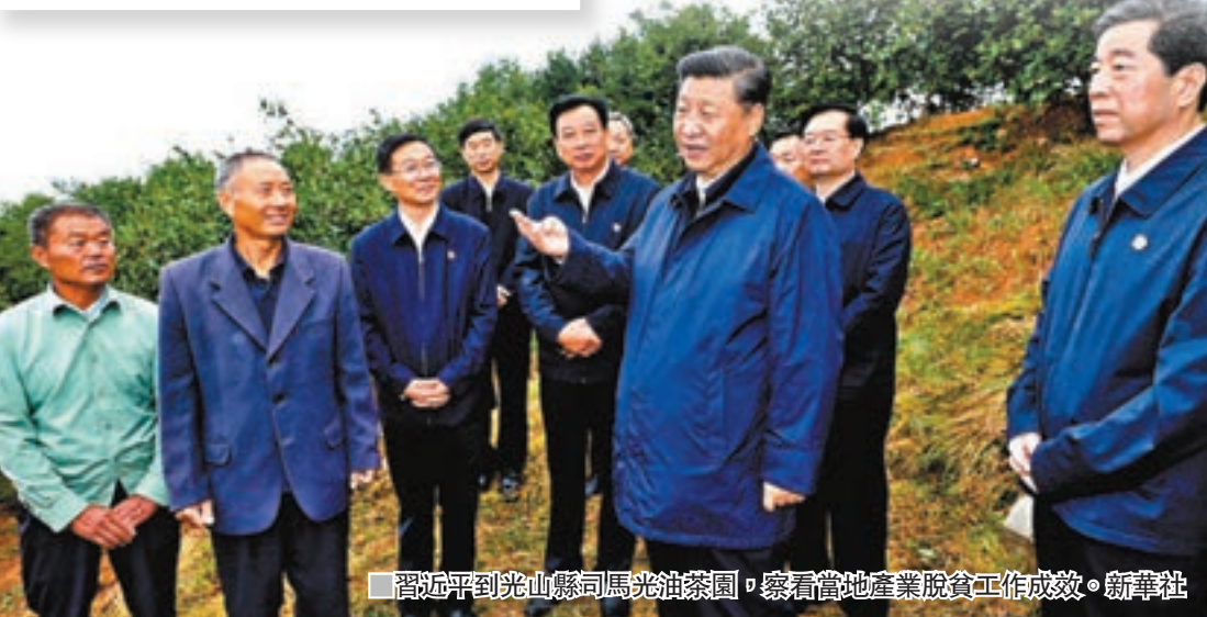
■習近平到光山縣司馬光油茶園，察看當地產業脫貧工作成效。