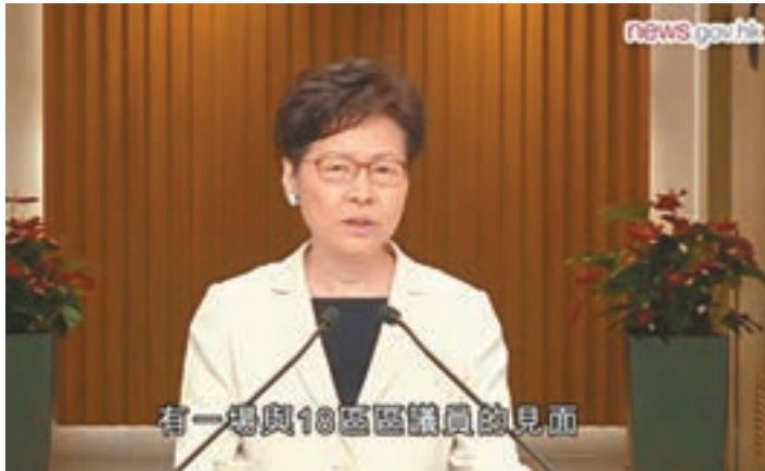
政府新聞網前天在網上預告,林鄭月娥於昨天與區議員對話。

香港文匯報訊(記者 郭家好)特首林鄭月娥繼早前提出「四項行動」,並邀請全港18區區議員於昨晚在政府總部對話,就香港面對的困局共商出路。據引述,林鄭月娥在開場發言時重申,現在最迫切的工作是要遏止暴力、捍衛法治和重建社會秩序,並希望以真誠深入的態度,與社會各階層、不同政見的人有直接對話,令特區政府往後工作做得更好。有區議員在會上希望特區政府推行反蒙面法,及參考當年英國制亂的措施。