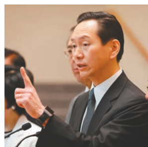
陳智思指不能「特赦」違法者。資料圖片

香港文匯報訊(記者 文根茂)行政會議召集人陳智思本周接受彭博通訊社訪問時指,特赦被控示威者「行不通(No go)」,因此舉違反法治原則,又認為愈來愈升級的暴力事件不會立即停止,即使特區政府接受所謂「五大訴求」,暴徒亦不會收手,直言所謂「訴求」只是假象。