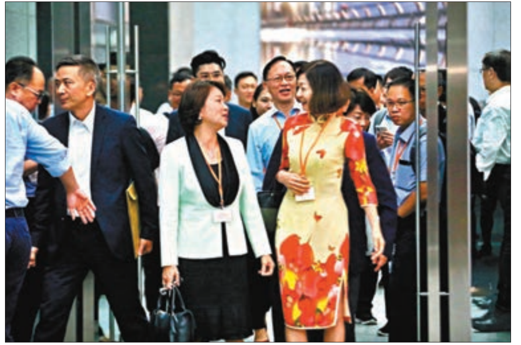
逾百位區議員出席對話會,其中亦包括反對派區議員。