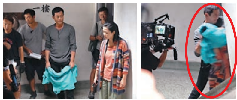
■古天樂於戲中對宣萱痛下殺手，用風褸笠着宣萱的頭部。