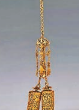
明鑲空鏤球雙龍金腰佩