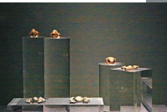
各色精緻飾品展現了明代女子典雅生活的一角。