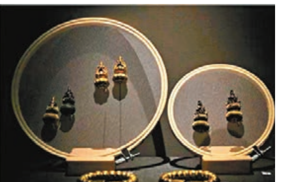
金葫蘆耳墜、金鑲寶葫蘆耳墜、金鏈珠鐲