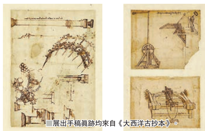
展出手稿真跡均來自《大西洋古抄本》。

展覽詳情： 日期：9月20日至12月15日 時間：上午10時至下午7時 地點：九龍塘達之路城大劉鳴煒學術樓18樓城大展覽館