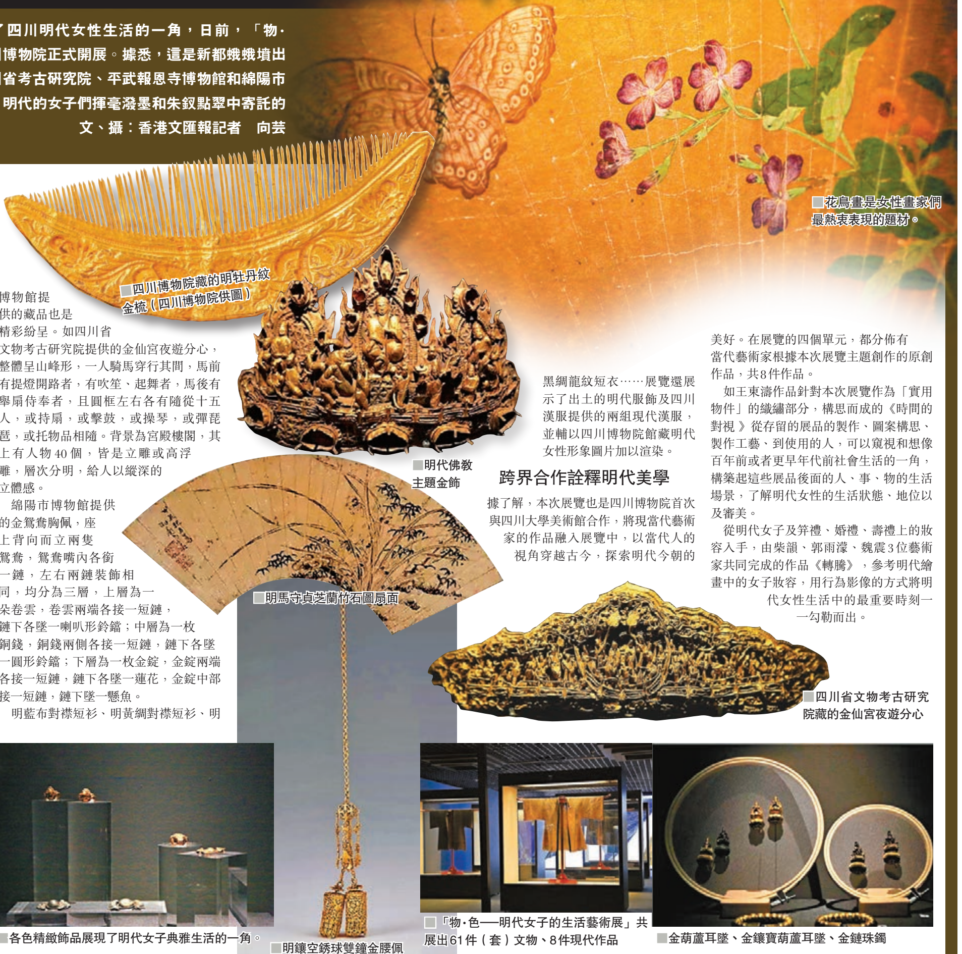
四川博物院藏的明牡丹紋金梳