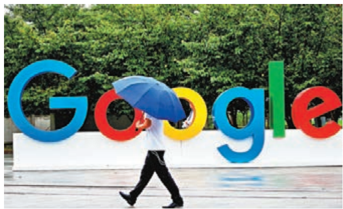
■Google香港發表《智慧數碼城市白皮書》。

香港文匯報訊（記者 郭家好）Google香港昨日發表《智慧數碼城市白皮書》第三及最終版，指不同年齡層的香港人在數碼應用方面均有提升，而商界中亦有89%企業表示會於未來兩年增加在數碼轉型上的投資，惟人才短缺仍然是數碼轉型的重大障礙，有64%企業及51%中小企業均表示在聘請擁有數碼科技知識的人才方面遇到困難。