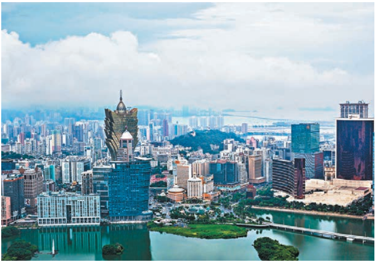
▶賀一誠指澳門是中西文化交流基地。圖為澳門城景。

在談到如何踐行「一國兩制」時，賀一誠認為，一定要先奠定好「一國」的概念，不能不講「一國」，只講「兩制」。他說，「一國兩制」，我們千萬不能走樣，不能變形。「一國」是前提，權力是從憲法裡面授權給你的，憲法裡面授權的基本法，從基本法裡面再授權我們的有關的行政、立法、司法三個方面的有關的權限。