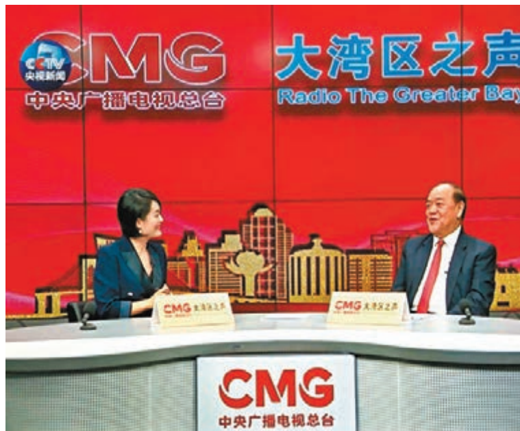
▲賀一誠接受央視節目專訪。 網上截圖

香港文匯報訊（記者 鄭治祖）澳門特別行政區第五任行政長官賀一誠近日就如何踐行「一國兩制」、澳門如何抓住大灣區發展的機遇等問題接受中央廣播電視總台大灣區之聲專訪。賀一誠強調，對於「一國兩制」，我們千萬不能走樣，不能變形。一定要先奠定好「一國」的概念，不能不講「一國」，只講「兩制」。「在『一國』的前提下，哪些是國家的行為，哪些是國家的底線，你不能碰的，不能走樣的，這樣是我們堅持下去。」在談到粵港澳大灣區發展時，賀一誠認為，大灣區要共同發展，而不是相互競爭。