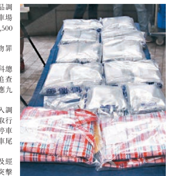
■警檢值2500萬元可卡因。 歲男子因涉嫌販毒及藏有第1部毒藥正被扣查。

另外，水警總區重案組探員根據線報及經深入調查後，昨早展開打擊毒品行動，突擊搜查停泊在三家村碼頭兩艘中式遊艇，檢獲市值超過10萬元的毒品，包括240克「冰」毒、34支咳藥水、少量氯胺酮及兩個懷疑「冰」壺。兩遊艇上兩名分別33歲及40