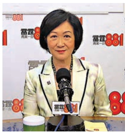
葉劉淑儀表示，寄望美國推動香港民主發展是單純的想法，這樣只會傷害香港。

香港文匯報訊(記者 鄭治祖)行政會議成員、新民黨主席葉劉淑儀昨日出席電台節目時表示，反修例者希望外國制裁香港，寄望美國推動香港民主發展是單純的想法，這樣只會傷