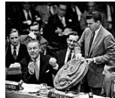
■ 美國1960年於聯合國公佈發現俄國竊聽器。網上圖片