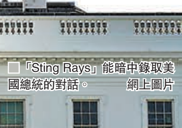
■ 「Sting Rays」能暗中錄取美國總統的對話。網上圖片