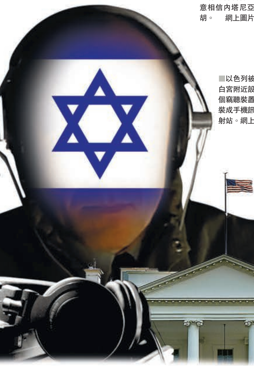
■ 以色列被指於白宮附近設置多個竊聽裝置，假裝成手機訊號發射站。