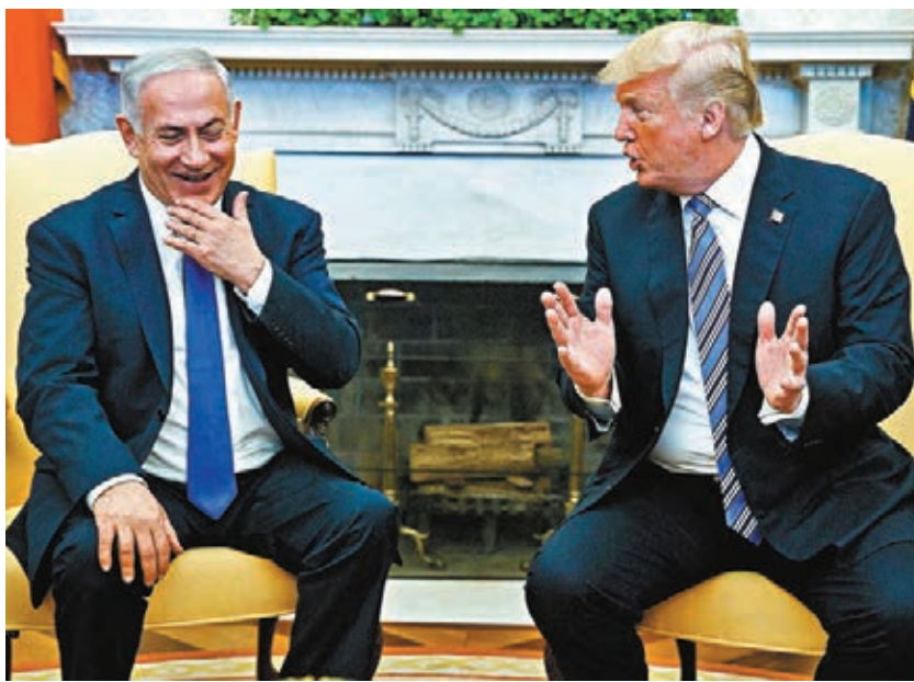
■ 特朗普(右)願意相信內塔尼亞胡。