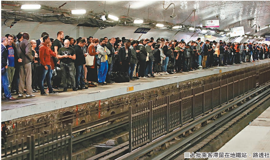
■ 大批乘客滯留在地鐵站。