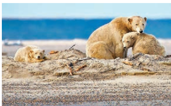
■ 新政策勢將危及北極熊等動物的棲息地。