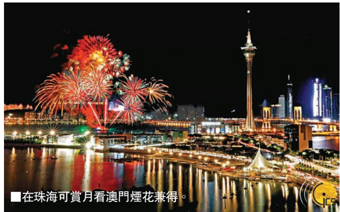
■在珠海可賞月看澳門煙花兼得。

共享珠澳月色之外，珠海不得不提的便是海島明月。一家老小一起感受一番「海上生明月，天涯共此時」的美好意境，似乎是郊區海島賞月最大的吸引力。而老牌的賞月海島，在珠海人看來非東澳島莫屬。