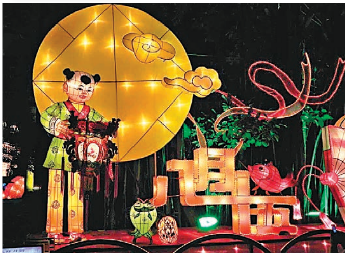
■廣州荔灣民俗風情表演。