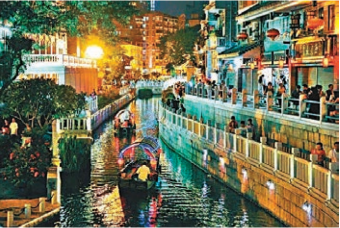
■廣州荔灣區河涌兩岸燈籠高掛，乘船賞月，南國風情依次漸開。