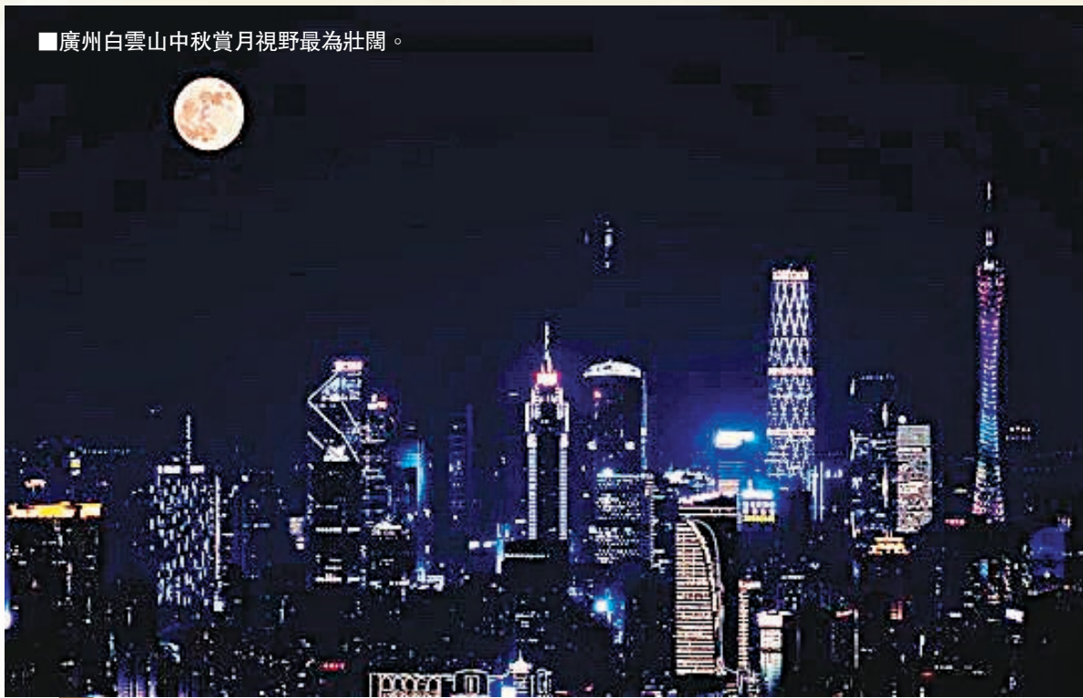
■廣州白雲山中秋賞月視野最為壯闊。