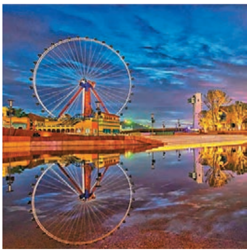
■佛山99米摩天輪，中秋賞月稀有體驗。

此外，還有《聲光電水舞》空間秀首次亮相，助興中秋佳節。入夜之後，歡樂海岸 PLUS《聲光電水舞》以水系為紐帶，將一河兩岸建築群及標誌性地標的燈光、音響系統串聯在一起，用激光、數碼噴泉、旱噴、音樂等在各區域形成不同的亮點，打造出超10萬平方米的大型全彩激光立體空間秀，借助中秋月夜，激發出佛山的夜間經濟。