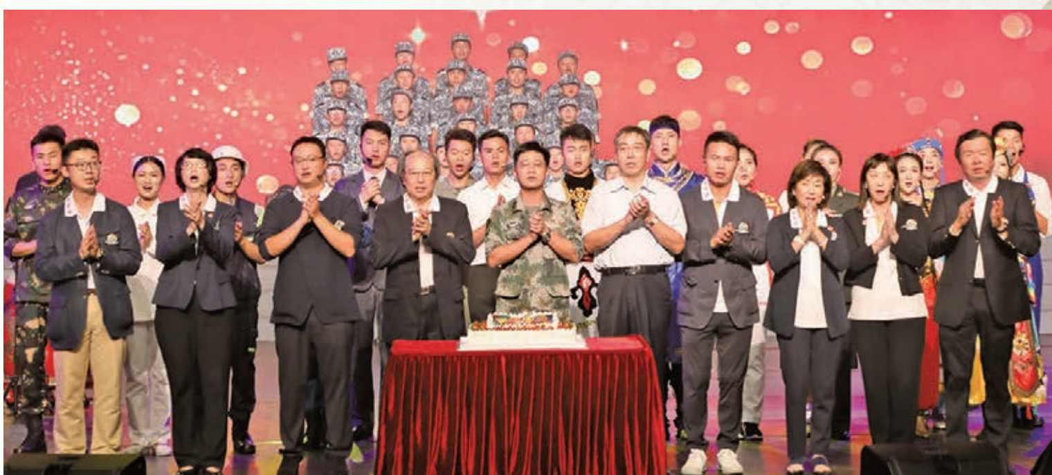
「軍民同樂慶中秋」活動以《歌唱祖國》一曲劃上圓滿的句號。