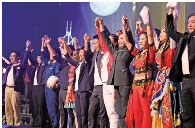
委員與駐軍官兵合唱《我和我的祖國》，共同表達對祖國的美好祝願。