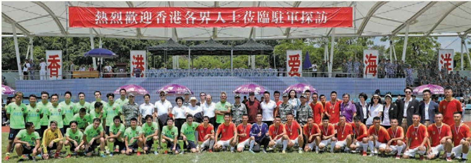
駐港部隊與香港明星足球隊進行友誼賽。