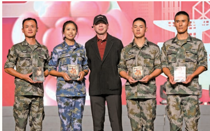
著名導演馮小剛擔任嘉賓之餘，更向四名幸運兒送上親筆簽名電影光碟。