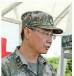
駐港部隊副政治委員陳亞丁表示，中秋探訪活動體現了軍民的魚水之情和香港同胞的關愛。