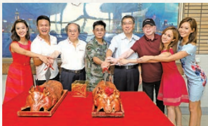
朱鼎健(左二起)、戴德豐、陳亞丁副政委、趙建凱副特派員、馮小剛導演及三位上屆香港小姐，一同主持切燒豬儀式。