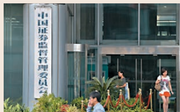
證監會日前召開會議，提出多項補齊多層次資本市場體系短板等任務。

召開會議研討細化資本市場改革總體方案。改革主要聚焦市場化、法治化、提高監管效能、對外開放四方面重點，而當前內地資本市場應對外部衝擊的韌性明顯增強。