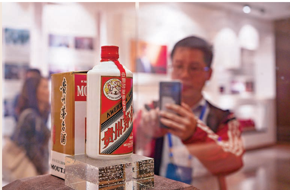
有業內人士認為，茅台酒價格大跌的傳聞有誇大之嫌，目前茅台酒價格雖有下行，但總體平穩，經銷商並未有出貨難題。資料圖片

市場有傳聞稱，北京地區茅台酒市場出現大幅度回落，「從上周最高2,650元到今天2,100元」，令商家頗為恐慌，甚至「無人敢接貨」。也有