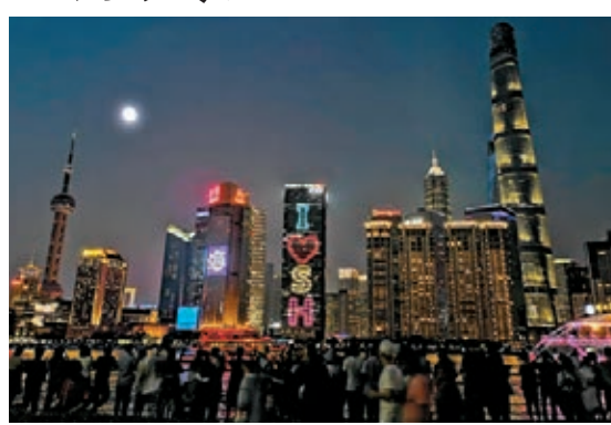
上海黃浦江邊密集的遊人遙望明月。

觀賞一場評彈、昆曲等小型演出，也成為夜間旅遊「新寵」產品。馬蜂窩旅遊研究中心負責人馮純分析稱，隨著內地夜間遊覽項目不斷豐富，為遊客的中秋之夜提供了更多的消費選擇。