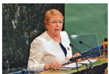
巴切萊特對香港示威越來越多的暴力事件感到不安。

香港文匯報訊 據中新社報道，聯合國人權事務高級專員巴切萊特昨日在聯合國人權理事會第四十二屆會議上表示，她對香港示威活動中出現越來越多的暴力事件感到不安，呼籲「示威者」依法和平行事。 巴切萊特在聯合國人權理事會第四十二屆會議開幕式上表示，她對最近一些示威活動中出現的暴力事件越來越多感到不安，呼籲「示威人群」採取和平合法方