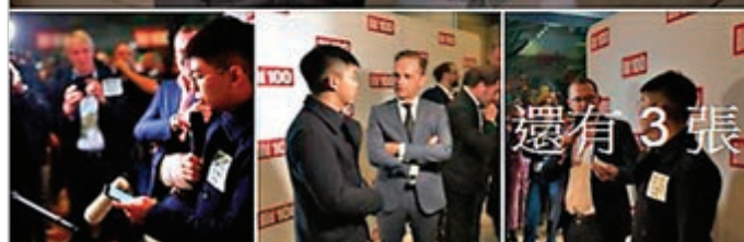
黃之鋒在fb大晒在德國受到「禮遇」。