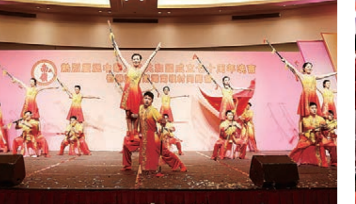
▲南嶺村青年舞蹈隊表演節目《竹枝詞》《紅旗頌》