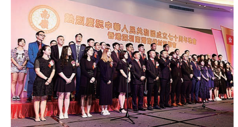
▲同鄉會執委表演合唱《勇敢的中國人》