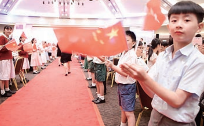
▲同鄉會中小學生在現場手揮國旗、區旗，表達愛國愛港之情