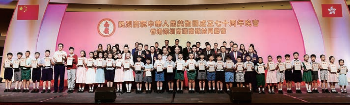
▲到會領導為中小學生頒發「愛國愛港」榮譽證書