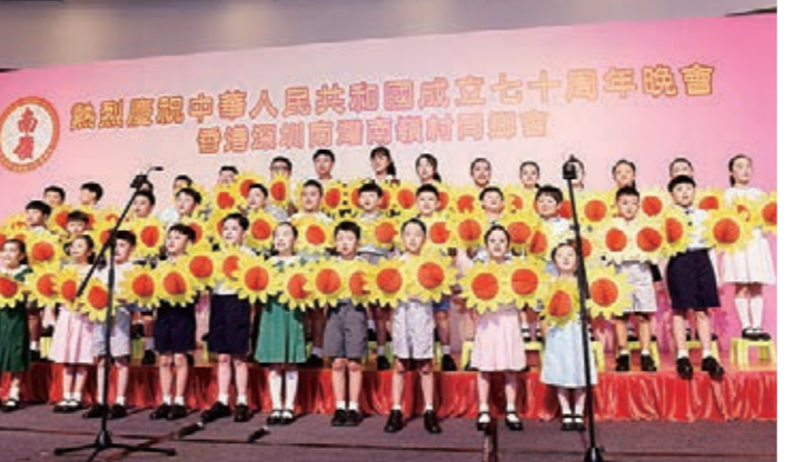
▲南嶺村同鄉會中小學生表演合唱《祖國的花朵》《歌聲與微笑》