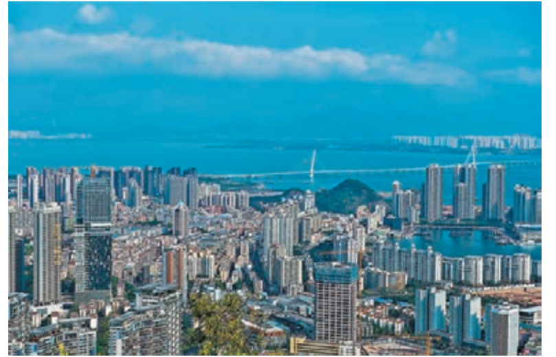
廣東自貿區深圳前海蛇口片區。 資料圖片