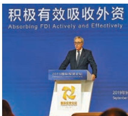
美國商務部前部長古鐵雷斯認為,正是美國採取了民粹主義和保護主義,令全球貿易受損。

香港文匯報記者了解到,本屆廈洽會期間,將舉辦包括國際投資論壇、「絲綢路海運」國際合作論壇、「一帶一路」等系列論壇及信息發佈活動,並推出3