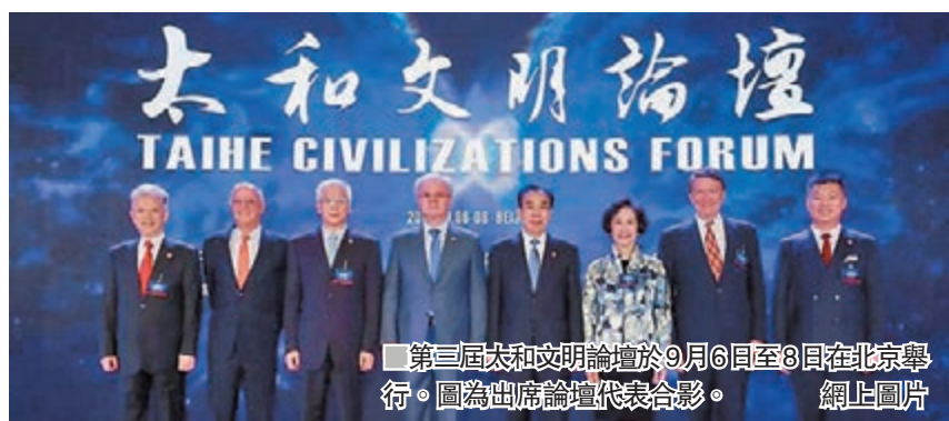
第三屆太和文明論壇於9月6日至8日在北京舉行。圖為出席論壇代表合影。網上圖片

第三屆太和文明論壇於9月6日至8日在北京舉行。論壇由太和智庫於2017年發起創立,以「科學文化,未來倫理,共同價值」為主題,旨在促進國家地區文明交流互鑒,推動人類社會和諧持續發展。本屆論壇下設國際關係、教育文化、前沿科技、「一帶一路」安全與發展、青年對話五個分論壇,來自國內外的各領域專家,圍繞相關議題展開了深入探討。