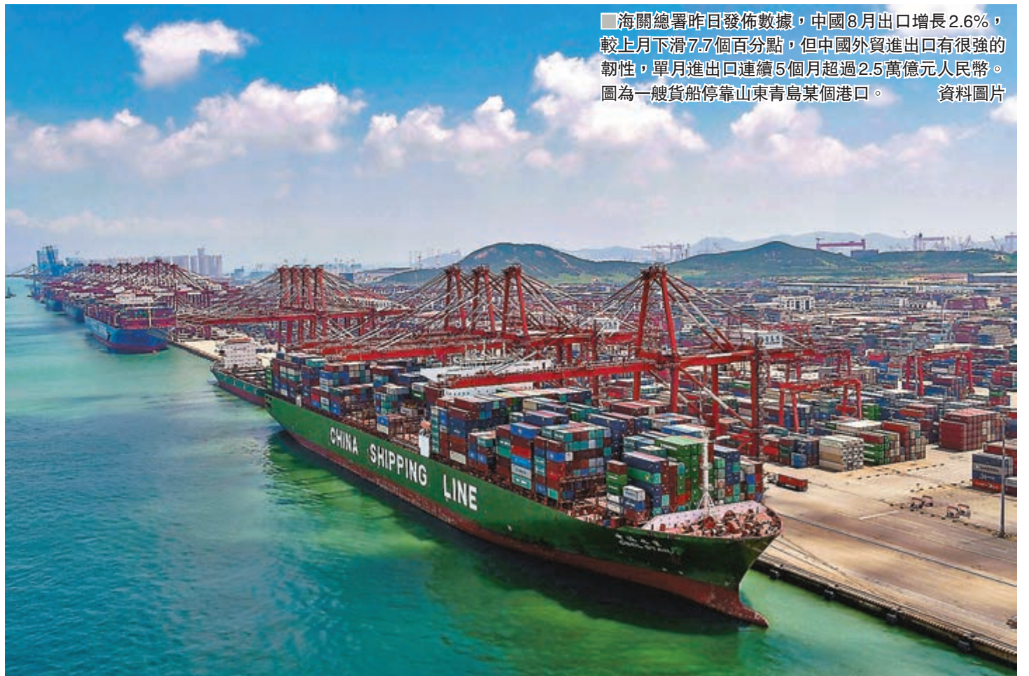
海關總署昨日發佈數據,中國8月出口增長2.6%,較上月下滑7.7個百分點,但中國外貿進出口有很強的韌性,單月進出口連續5個月超過2.5萬億元人民幣。圖為一艘貨船停靠山東青島某港口。資料圖片

香港文匯報訊(記者 海巖 北京報道)海關總署昨日發佈數據,由於新一輪加徵關稅落地前企業搶出口不及預期,中國8月出口增長2.6%,較上月下滑7.7個百分點;隨著中美貿易戰升級,當月對美出口同比下滑16%,創今年3月以來最大降幅,自美國進口亦連續第12個月減少;與此同時,中國對日本、俄羅斯、越南等地出口明顯提速。海關總署表示,當前國際經濟、貿易增長放緩,但中國外貿進出口有很強的韌性,單月進出口連續5個月超過2.5萬億元(人民幣,下同),下一步將全力促進外貿穩中提質。