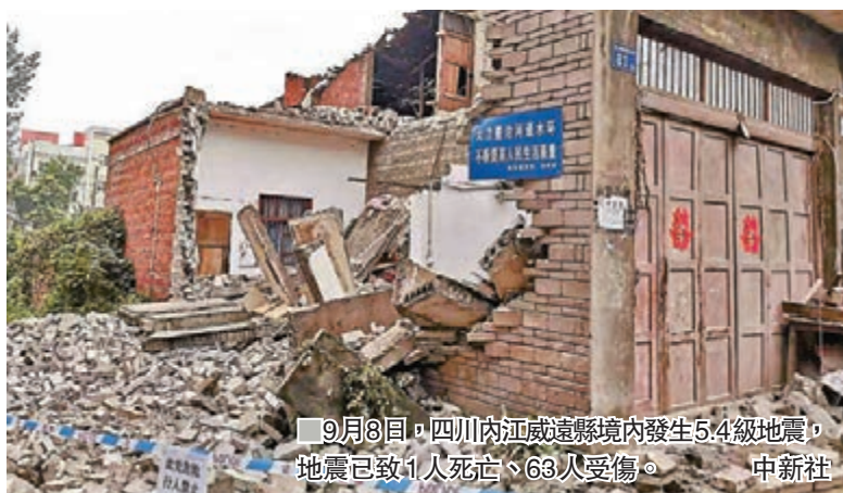
9月8日,四川內江威遠縣境內發生5.4級地震,地震已致1人死亡、63人受傷。

香港文匯報訊 據新華社報道,據四川省內江市應急管理局消息,截至9月8日18時,威遠5.4級地震已致1人死亡、63人受傷,其中重傷3人。此次地震受災鄉鎮63個,受災人數10,883人,房屋倒塌132間、嚴重受損161間、輕微受損4,880間,轉移並安置受災群眾2,417人。