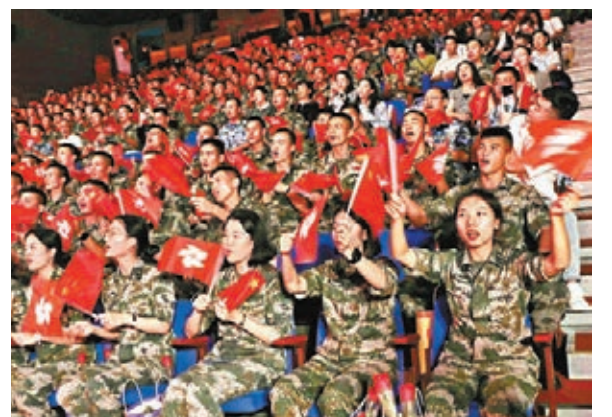
▲全場官兵一同揮動國旗、區旗,高唱《我和我的祖國》。