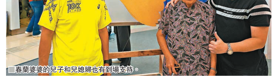
■春蘭婆婆的兒子和兒媳婦也有到場支持。

展覽當天春蘭婆婆的兒子和兒媳婦也到場支持，他們憶述婆婆總是提醒他們即使生命遇上逆境，也要盡力面對，尋求解決問題的各種方法，之後持之以恆地去完成，她的精神深深感染