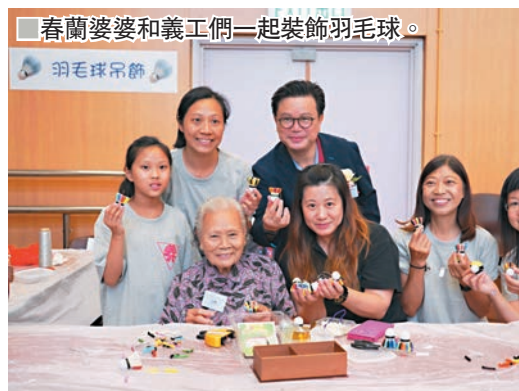
■春蘭婆婆和義工們一起裝飾羽毛球。