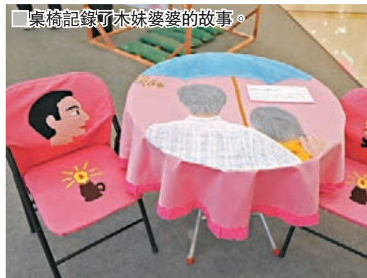
■桌椅記錄了木妹婆婆的故事。