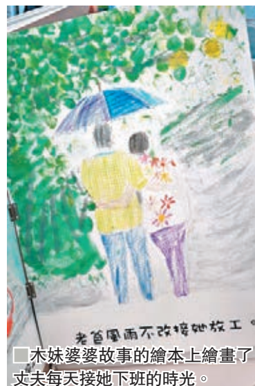
■木妹婆婆故事的繪本上繪畫了丈夫每天接她下班的時光。