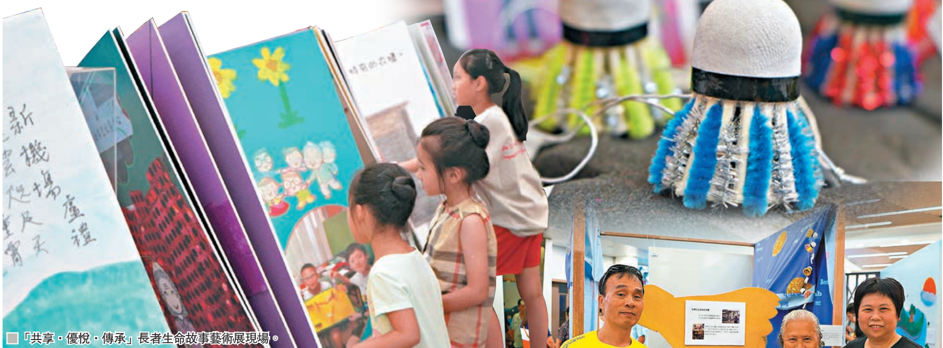
■「共享·優悅·傳承」長者生命故事藝術展現場。