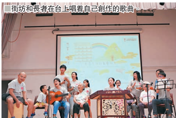
■街坊和長者在台上唱着自己創作的歌曲。