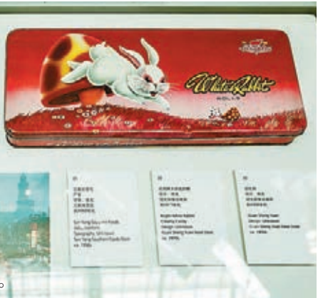
■大白兔奶糖的早期包裝。

時下風靡海內外的大白兔奶糖系列，曾經有過紅色的包裝；已經走時尚路線的老牌化妝品品牌美加淨上世紀八十年代就有了粉餅；孩子們都喜愛的光明牌奶油雪糕當年的包裝紙也類似一幅漫畫；當歐美日本品牌人盡皆知的今天，美術學子並不知道上海產的顏料也並不遜色於海外同行……徜徉在一幀幀包裝紙和產品設計包裝陳列櫃中，觀眾可以窺見上世紀八十年代上海的流行風尚。主辦方還特別告訴記者，舉辦這樣的展覽就是欲借這樣一個平台，面向海內外尋找這些物品的當年的設計師。在那個年代，尚無明確的知識產權概念，參與產品包裝設計和人工繪畫的藝術家們大多不留