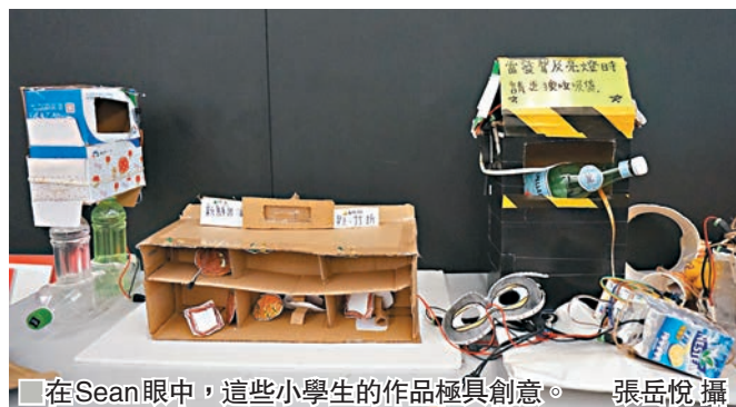
■在Sean眼中，這些小學生的作品極具創意。