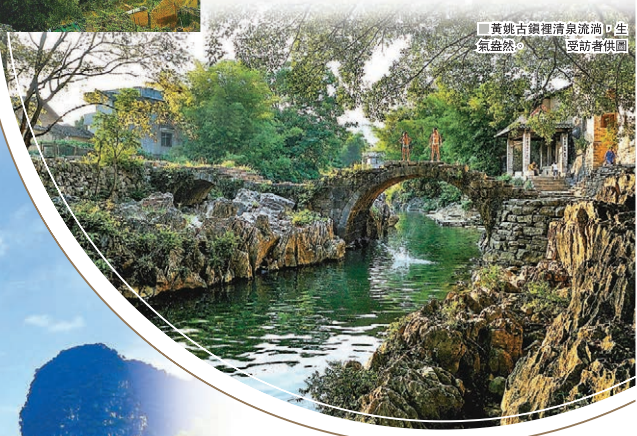
黃姚古鎮裡清泉流淌，生氣盎然。

如果太平門是黃姚古鎮的門臉，那麼守望樓就像是盡責的衛士，守護着整個黃姚古鎮。守望樓是很重要的城樓之一，用於守關、瞭望，設有瞭望孔和槍眼，樓的一邊是高石牆，另一邊臨水，易守難攻，是防禦外敵的重要建築物。遊客到了黃姚古鎮，可以仔細觀看，近距離接觸古人的智慧。