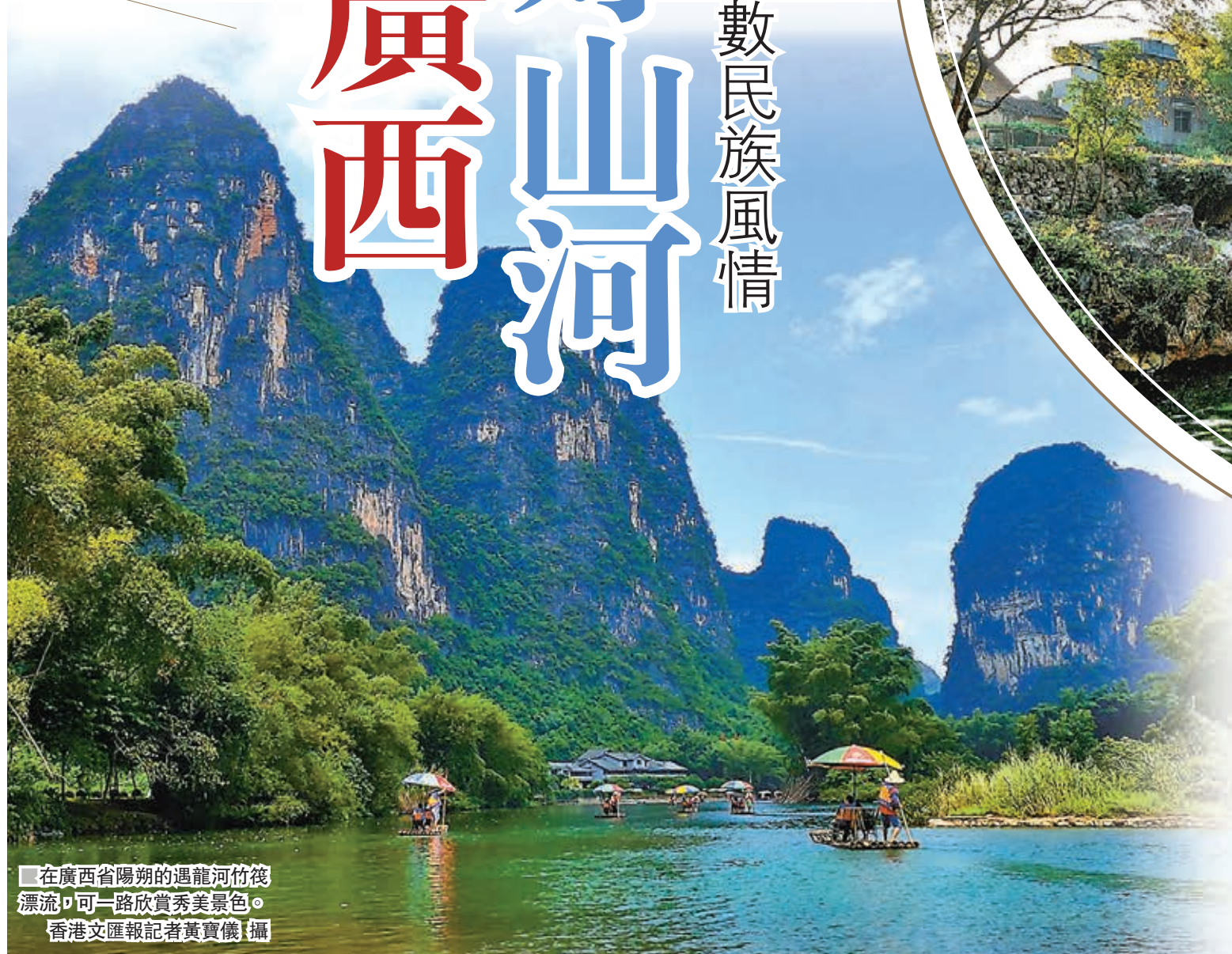
在廣西省陽朔的遇龍河竹筏漂流，可一路欣賞秀美景色。

2019年泛珠三角區域合作行政首長聯席會議昨日在廣西南寧舉行。此次會議的舉辦地廣西，自古以來與廣東合稱「兩廣」，有眾多民族聚居，有號稱「桂林山水甲天下」的自然風光，也有20元人民幣背景圖案的網紅景點。港人不妨趁着周末乘坐高鐵來一趟說走就走的旅程，看不一樣的壯麗山河。 ■香港文匯報記者 黃寶儀 廣西報道