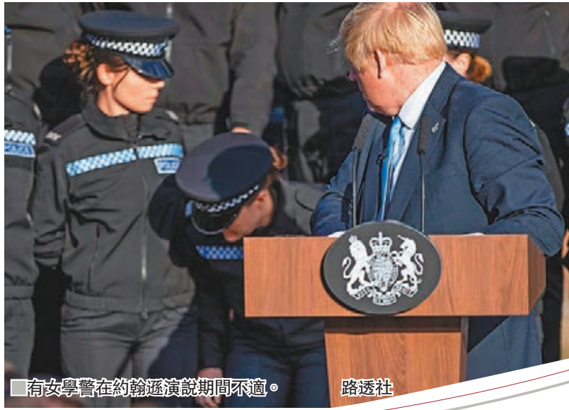
有女學警在約翰遜演說期間不適。