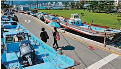
釜山有漁船被放置在路邊。