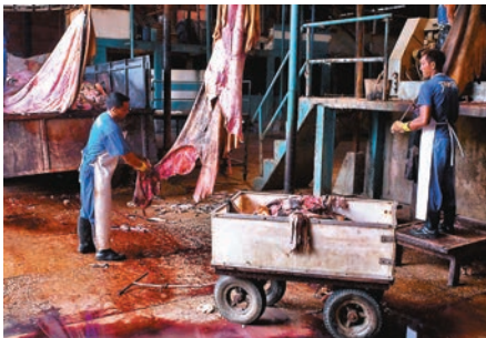
亞馬遜大火被指和養殖牛隻有關。