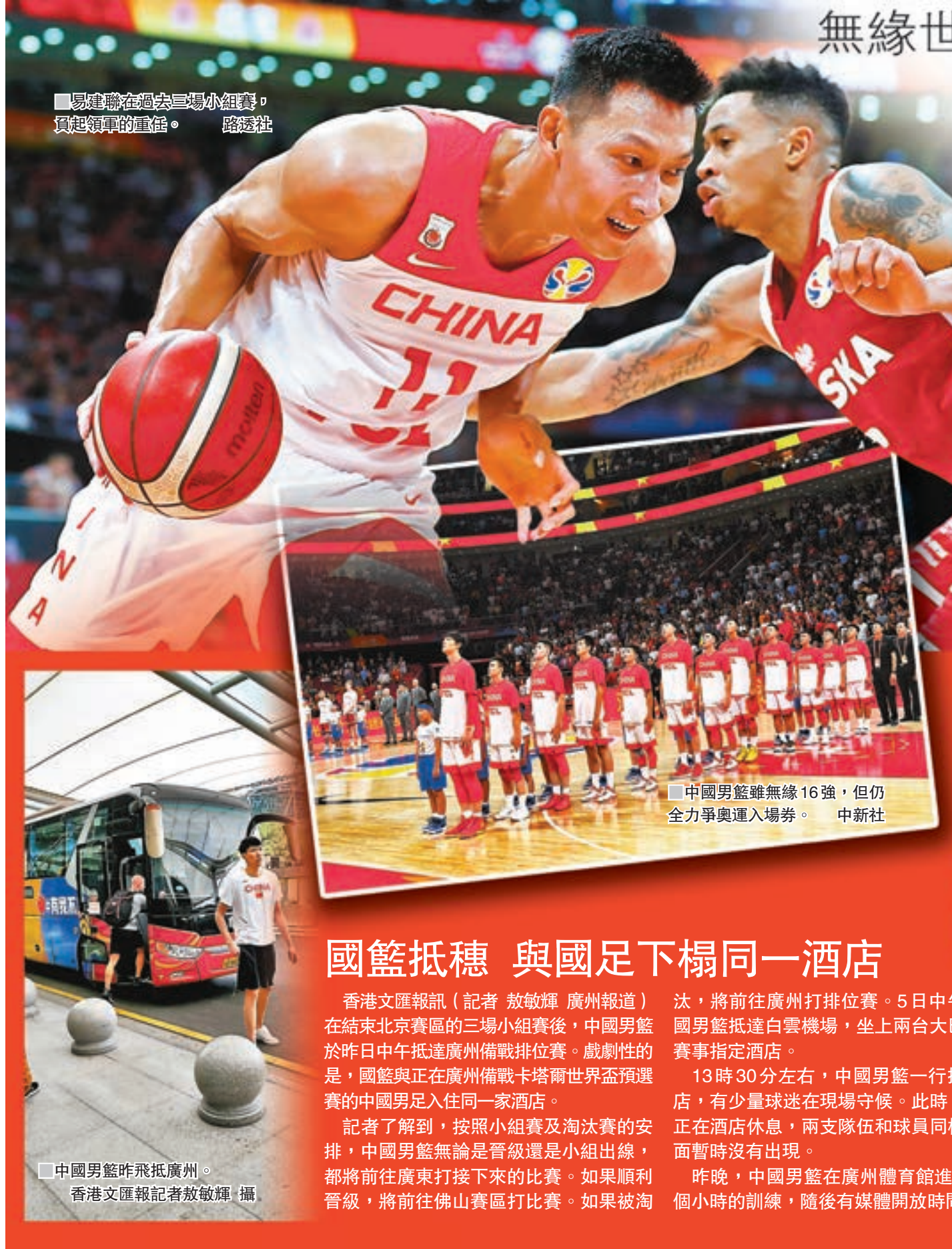
中國男籃雖無緣16強,但仍全力爭奧運入場券。