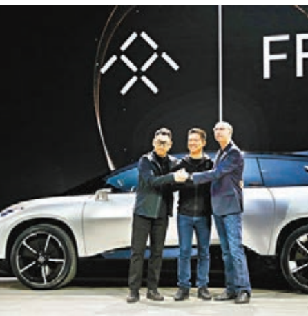
賈躍亭在微博中表示,「我之所以放棄一切,只為把FF做成。」

樂視網的半年報顯示,今年上半年樂視網總營收為2.53億元,同比下滑近75%;歸屬於上市公司股東的淨虧損為100.46億元。截至今年6月底,公司合併報表範圍內應付票據及應付賬款32.03億元,主要為應付供應商及服務商欠款;長短期借款共5.55億元,其他流動負債33.04億元,主要為公司向金融機構及非金融企業借款產生。