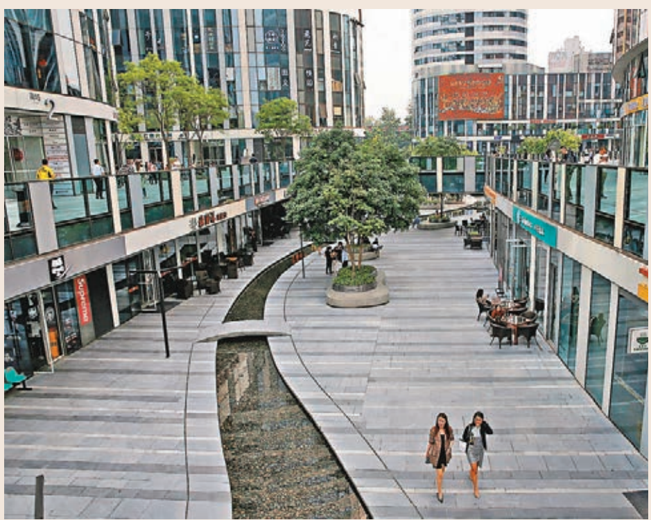
上月財新中國通用服務業經營活動指數較7月回升0.5個百分點,創三個月新高。圖為北京三里屯商業區。

報指出,8月內地企業生產經營活動擴張,主要受新訂單增長所帶動。其中,服務業新訂單增速可觀,為4個月來最顯著,是增長主力。受訪服務業企業表示,新訂單增長主要受益於潛在需求轉強、新項目帶來商機。期內,製造業新訂單總量則基本持平。