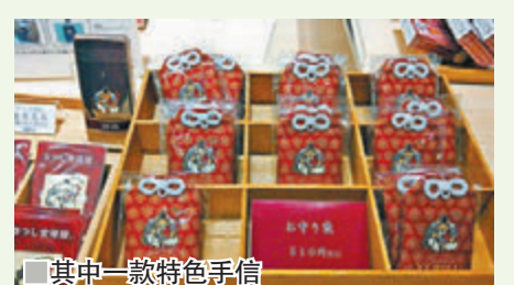
其中一款特色手信