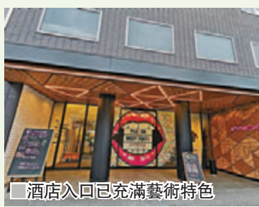
酒店入口已充滿藝術特色