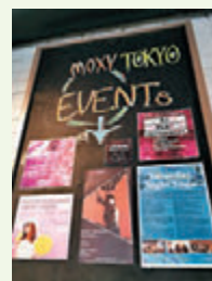
酒店定時會舉辦不同的活動。