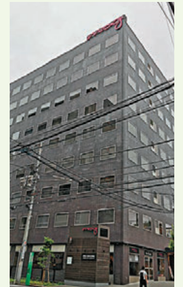
位於錦系町的 Moxy Hotels