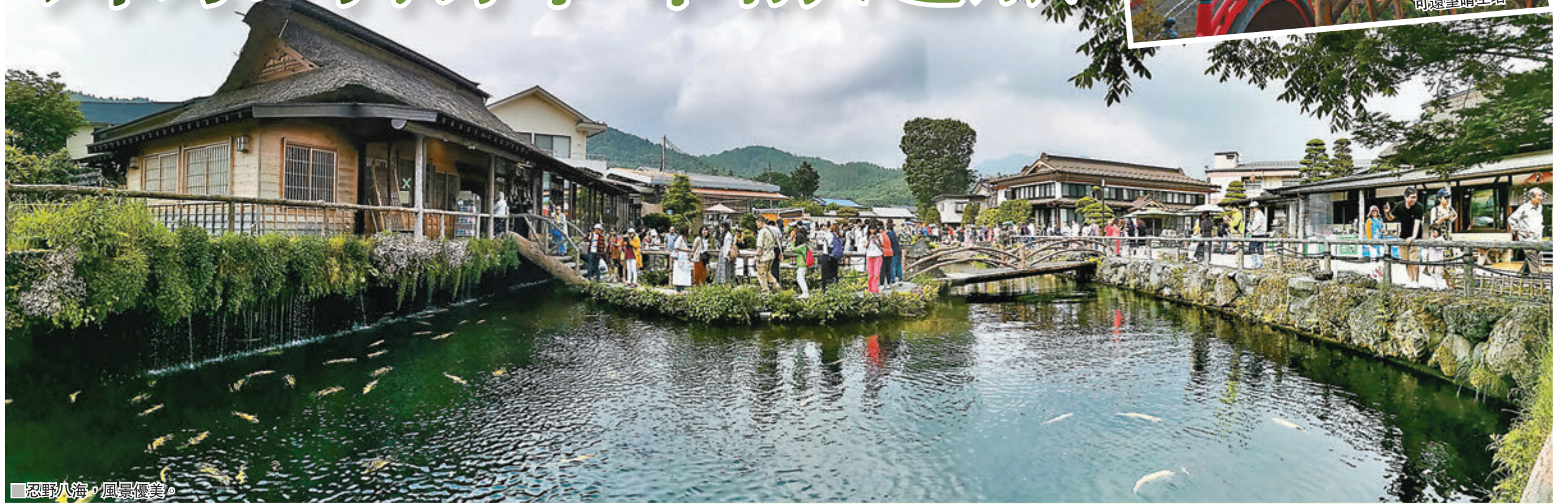
忍野八海，風景優美。

日本是港人喜愛旅遊的地方，的確無容置疑，而東京對港人而言更不陌生，東京鐵塔、晴空塔等景點相信人人皆知。今次筆者帶大家遠離東京熱鬧繁華的地方，到近郊的地方遊覽，感受不一樣的自然風光，加上東京地鐵四通八達，就算在遠離市區的錦系町住宿也極方便，亦可順道參觀周邊的自然美景，寫意一番。