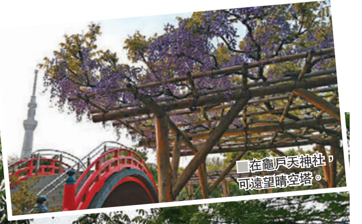
在龜戶天神社，可遠望晴空塔。