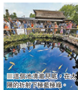
這個池清澈見底，在太陽的折射下藍綠極。