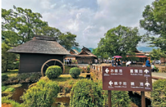
有指示牌指示不同池的方向