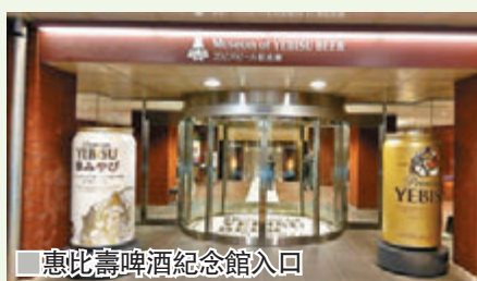
惠比壽啤酒紀念館入口