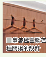
筆者極喜歡這種開揚的設計