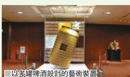
以多罐啤酒設計的藝術裝置