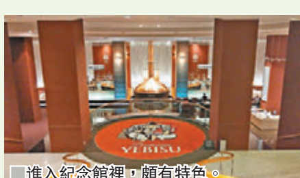
進入紀念館裡，頗有特色。

雖然筆者不是癡狂喝酒之人，但也喜歡在不同地方品嚐當地的啤酒，於是筆者自己找到了這間 YEBISU 啤酒紀念館，就獨個兒去參觀一下。紀念館的入口就在 SAPPORO 啤酒總公司對面的右手邊，距離惠比壽車站不遠，交通很方便，旁邊也有惠比壽三越百貨公司。