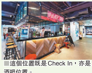
這個位置既是 Check In，亦是酒吧位置。