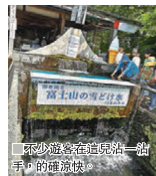
不少遊客在這兒沾一沾手，的確涼快。